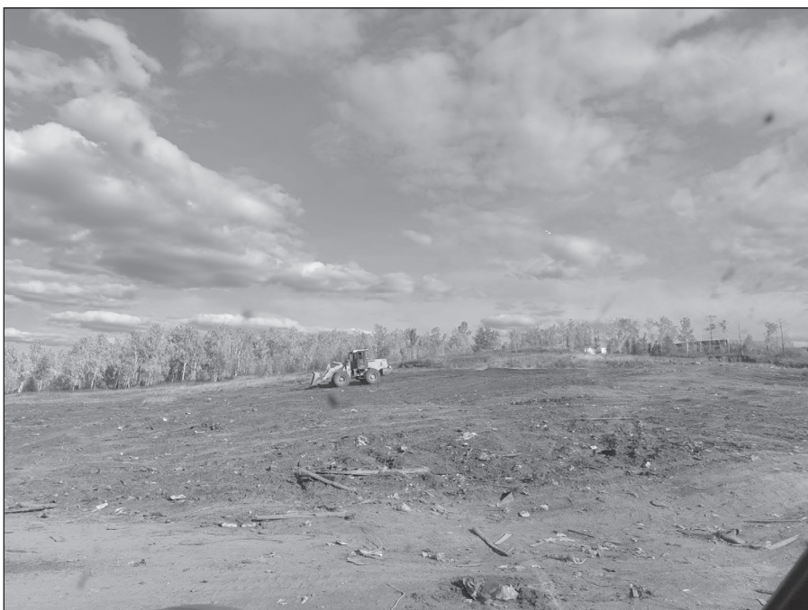
Несанкционированная свалка на Булуе ликвидирована, вывоз мусора сюда категорически запрещен

- В этом году с участка свалки, находящегося в земельных границах поселка Качуг, на полигон ТБО в Ангарский район вывезено 2 185 тонн мусора. Весь этот мусор складировался на Булуе еще с советских времен. И это еще не всё. До конца октября Регоператор вывезет с Булуя мусор, который копил здесь последние два года. Это мусор с контейнерных площадок поселка. Мусор находится на определенной еще в 2020 году площадке для временного складирования. Соответствующее гарантийное письмо об обязательствах по срокам вывоза этого мусора от