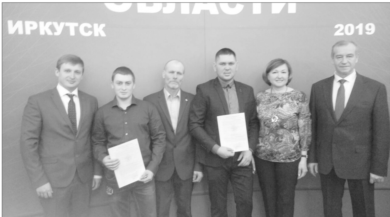
● Район. Точка роста