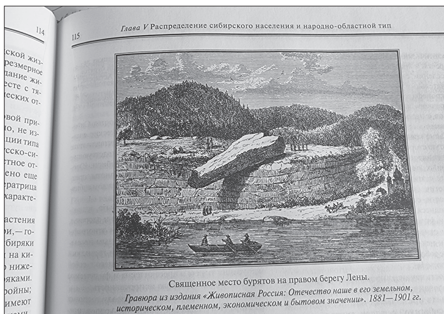
Священное место бурят на правом берегу Лены. Гравюра из издания «Живописная Россия: Отечество наше в его земельном, историческом, племенном, экономическом и бытовом значении». 1881—1901 гг.

Первые русские казаки появились в Верхнеленье в 1631 году. Отряд казаков в 30 человек поднялся