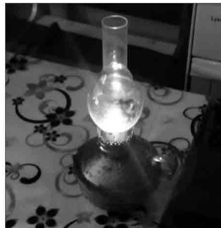
В ожидании...

фик отключения электроэнергии для выполнения работ согласовывается с потребителями через сельскую и районную администрации. Таким образом, в рабочие дни электроэнергия отключается с 13-00-14-00 до 18-00, в выходные дни по четным дням с 9-00 до 18-00, по нечетным с 14-00 до 18-00. Дополнительно информация рассылается жителям по СМС сообщениям. Если понижается температура ниже тридцати градусов, отключение электроэнергии отменяется. По мониторингу на 26.11.2018 года из-за выхода из строя техники подрядчику понадобится еще одно, максимум два отключения в декабре. В случае невыполнения запланированных нами