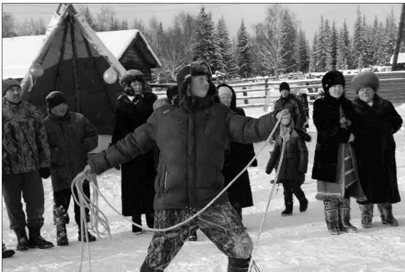
Метание маута (верёвка) на хорей (рога)