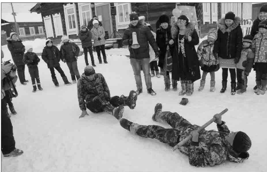
Сегодня у жителей Тутуры самый весёлый день в году

окрасу темнее таежных. Мы чужаков сразу видим. Дело до того доходило, что голодные шату-