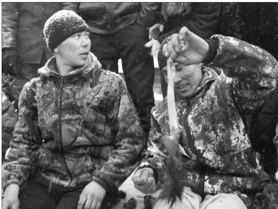
На обдирание белок участники потратили не больше трех минут