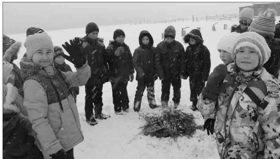
Ритуал окуривания заинтересовал маленьких болельщиков