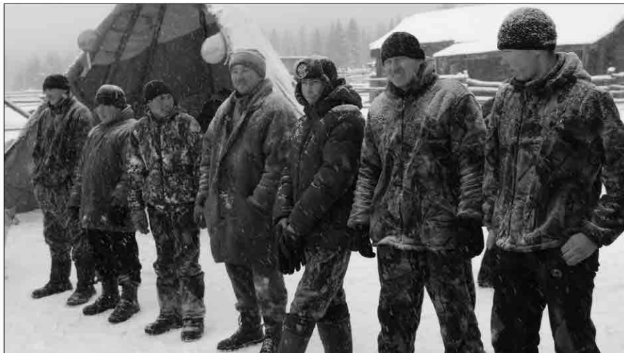
Соревновательный день выдался тёплым и снежным