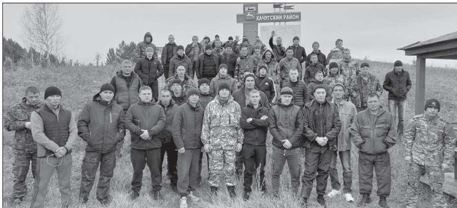
54 бойца Качугского района отправились на переподготовку в Новосибирск