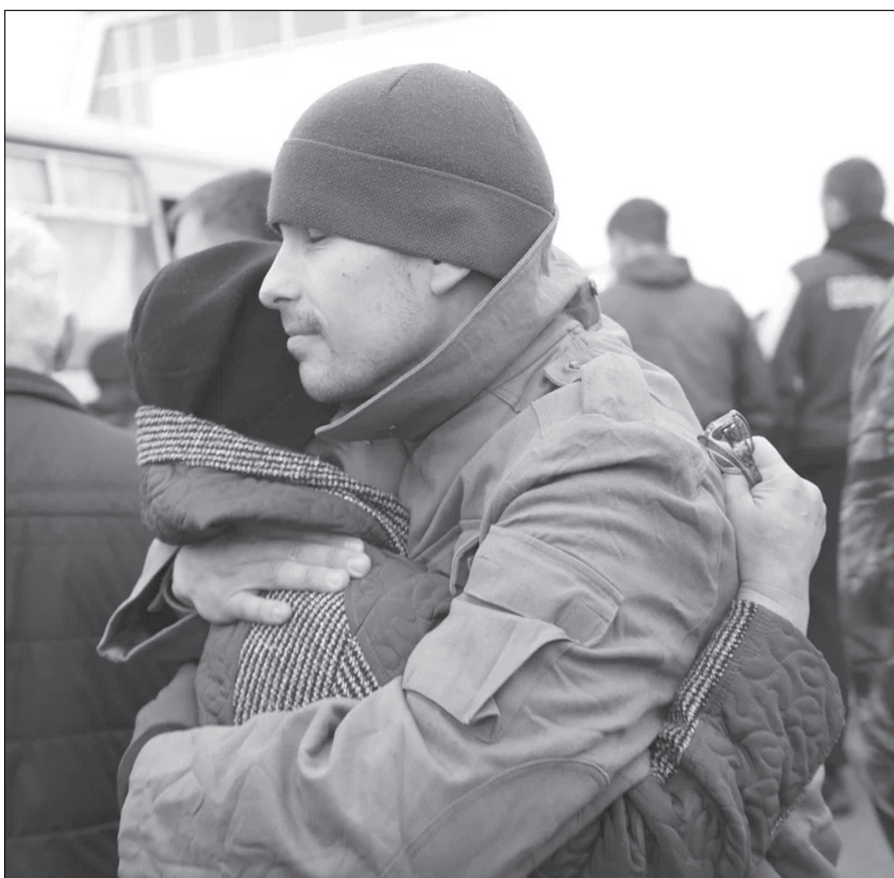
Тихие проводы, искренние объятия

- Я уроженец деревни Малые Голы. Всё своё детство я провёл там, учился в школе. Сейчас живу в Качуге. Срочную службу прошел в 2016 году. Многим моим знакомым, друзьям пришли повестки и они рады этому. Да, я не оговорился, мои друзья рады, что поедут в зону спецоперации. Я не смог остаться в стороне. Кто, если не мы! Мой дед военный и прадед воевал. Думаю, что они бы гордились мной сейчас. Родители и жена, конечно, тяжело восприняли моё решение. Поговорив, мне уда-