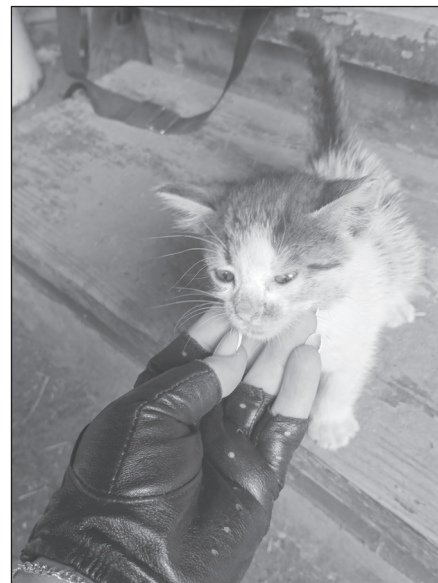
Маленького Грома выкормил из пипетки боец с позывным Кольма