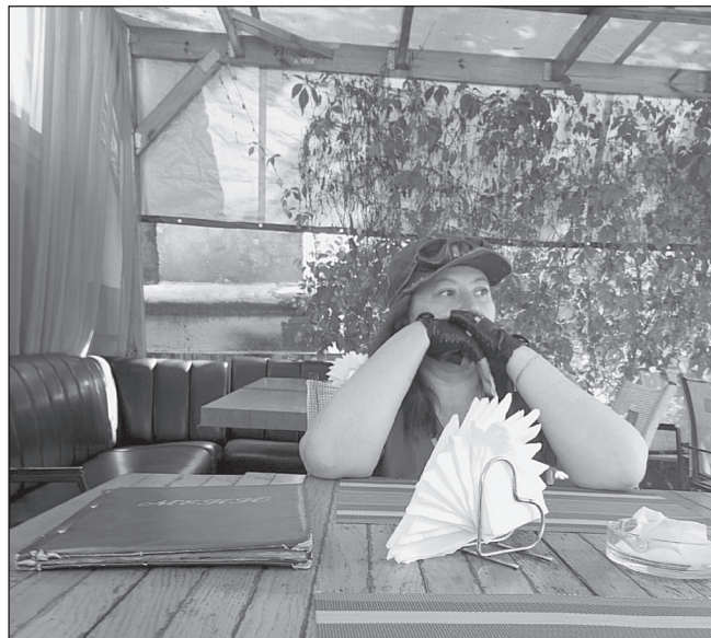
В прифронтовом городе заведения общепита не остаются без посетителей