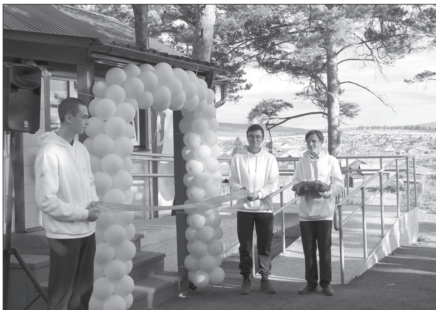
На проведение капитального ремонта здания в парке Роща израсходовано 13,5 млн. рублей из областного и местного бюджетов

Разрабатывалась проектно-сметная документация на ремонт здания,