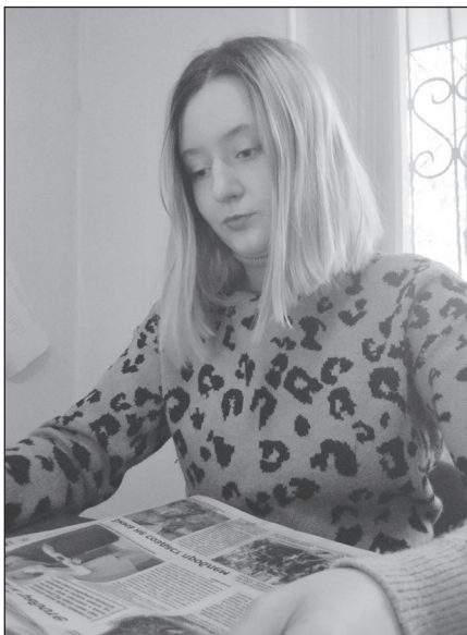
Молодой корреспондент уверена, что газеты будут жить