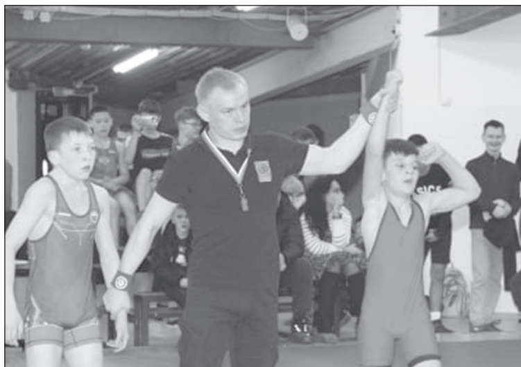
Первый Межрегиональный турнир по греко-римской борьбе среди юношей на призы Заслуженного тренера России, Заслуженного мастера спорта А.В. Хаустова