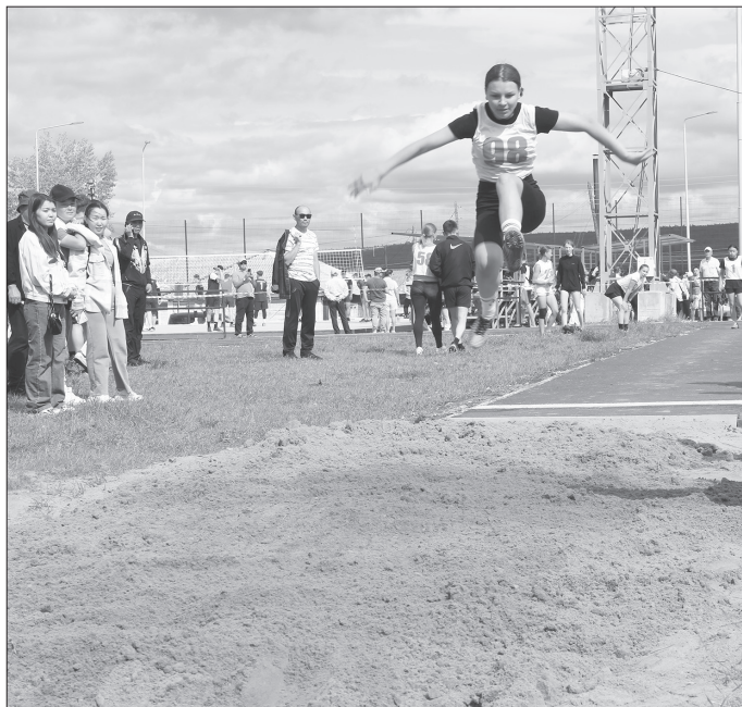
Допрыгнет до победы?