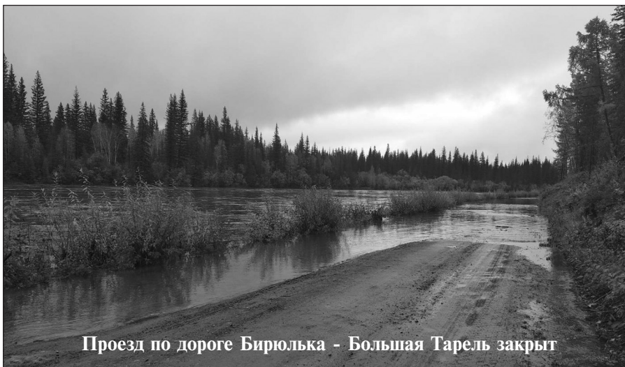
Проезд по дороге Бирюлька - Большая Тарель закрыт