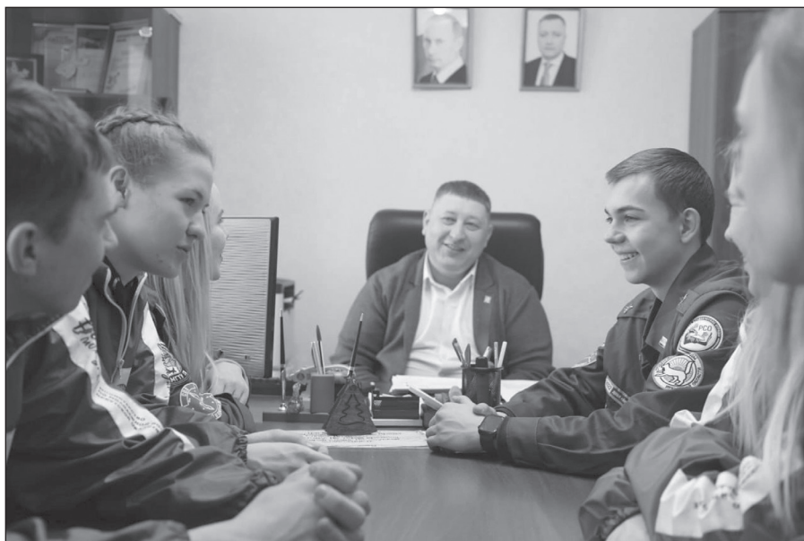
Теплая беседа в кабинете мэра

С 30 января по 4 февраля на территории нашего района трудились 12 бойцов отряда «Эскимосы». За эти дни ребята провели огромную работу! Посетили четыре школы: Харбатовскую, Манзурскую, Бирюльскую, Качугскую школу №1 и Балаганский техникум. Поработали с детьми младших классов: дали мастер-класс по изготовлению поделок для начальной школы. Важно отметить, занятия с малышами отличились дисциплиной. Младшие школьники тянутся к молодежи, впитывают каждое слово. Студенты провели эстафеты по ЗОЖ для 5-8-ых классов. А для старшеклассников провели профориентационную беседу. Большой интерес вызвала у выпускников информация по поступлению и учёбе в вузах. Студенты дали старшеклассникам ту информацию, которую не увидишь на официальных сайтах учебных заведений. Работу в школе завершали концертом. Были и патриотические номера, и песни под гитару, и зажигательные танцы. За всё время работы в школах не встретилось ни одного скупающего ученика.