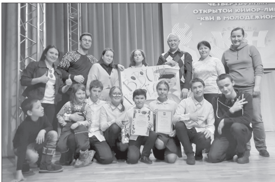
Залогские «Вовочки» заняли 1-ое место среди 11 школьных команд области