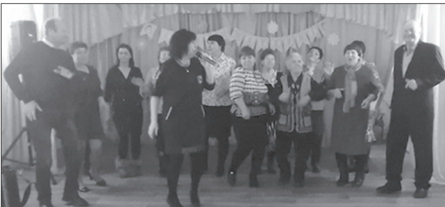
...в с. Бирюлька