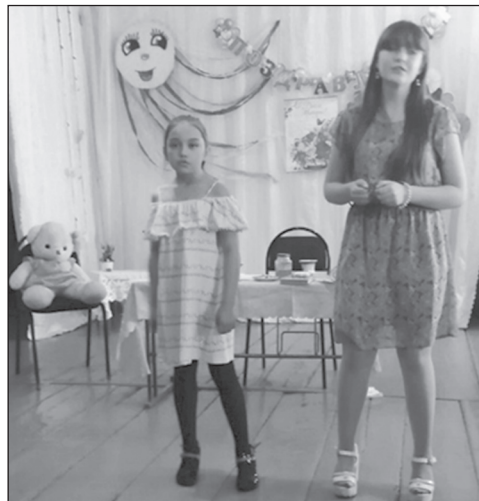
...в д. Косогол