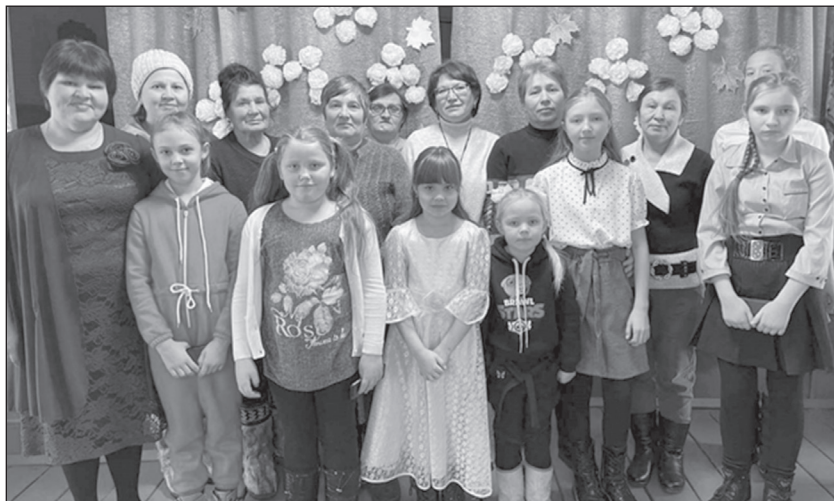
...в д. Малая Тарель