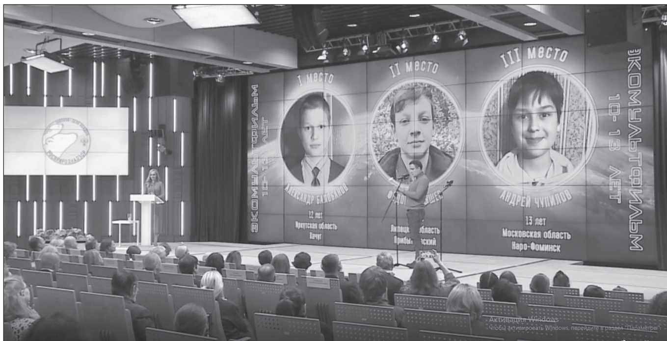
Имена победителей были объявлены на итоговой конференции в Москве 24 ноября, трансляцию смотрела вся планета