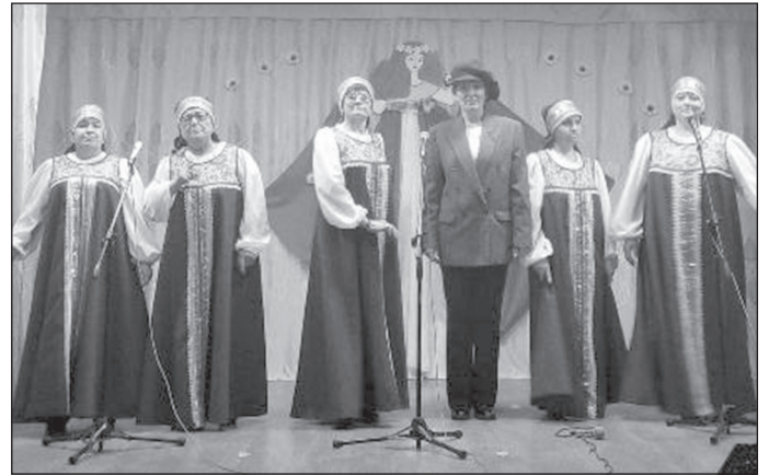
Празднование в с. Бутаково...