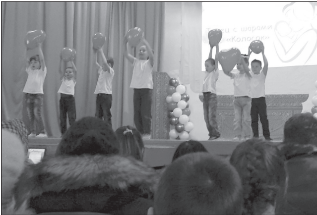
На сцене детского сада «Колосок», с. Анга