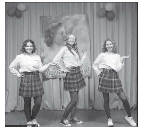
...в д. Аргун