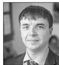
Максим Романов, мэр Нижнеилымского района:

ект, новый проект, таких в области еще нет. Он объединит в себе музыкальную и художественную школу. В этом году мы отремонтировали практически все, что планировали.