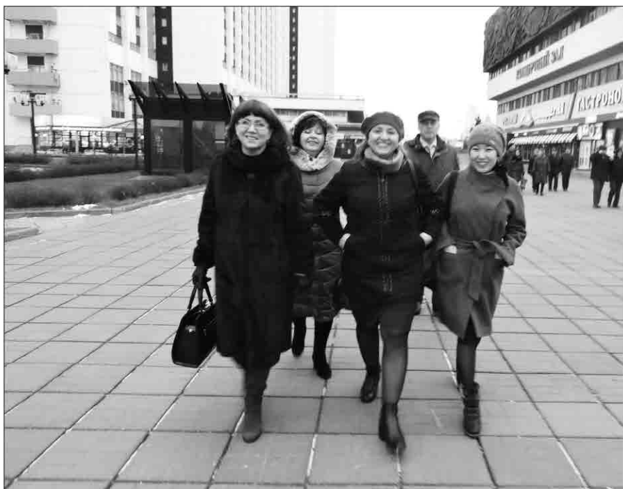
Идут, шагают по Москве журналисты Иркутской области

- Когда я вижу районки, где тиражи три тысячи экземпляров на пятнадцать тысяч населения, знаю, как они без средств выживают в своих территориях и при этом еще борются за свой народ, когда я слушаю радио и теле-региональные программы, которые зачастую интереснее и уверенней столичных, когда я вижу работу в горячих точках моих товарищей, могу с гордостью утверждать — журналистика в России жива, и она будет жить