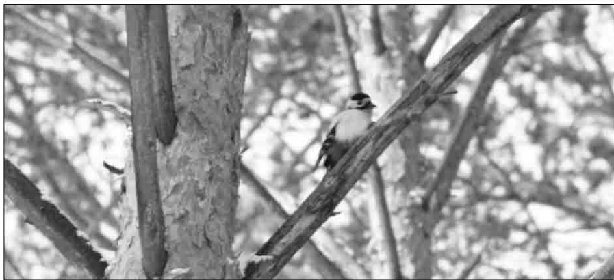
Холодно дятлу в больничной роще, пригорюнился