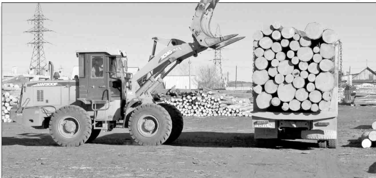
Сейчас в Иркутской области на учет поставлены 1569 пунктов приема и отгрузки древесины. Для тех, кто пытается работать в обход закона, предусмотрены серьезные штрафы: от 400 до 500 тысяч рублей – с организации, от 40 до 50 тысяч – с частного предпринимателя