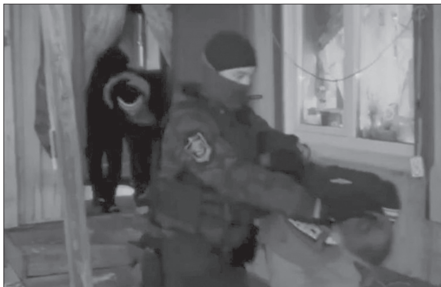
Двоих подозреваемых задержали в Качугском районе, они пытались скрыться в доме у знакомых

В том числе арестован обвиняемый по пункту «и» части 2 статьи 105 УК РФ «Убийство из хулиганских побуждений» и по части 2 статьи 213 УК РФ «Хулиганство, совершенное группой», а также пять его подельников