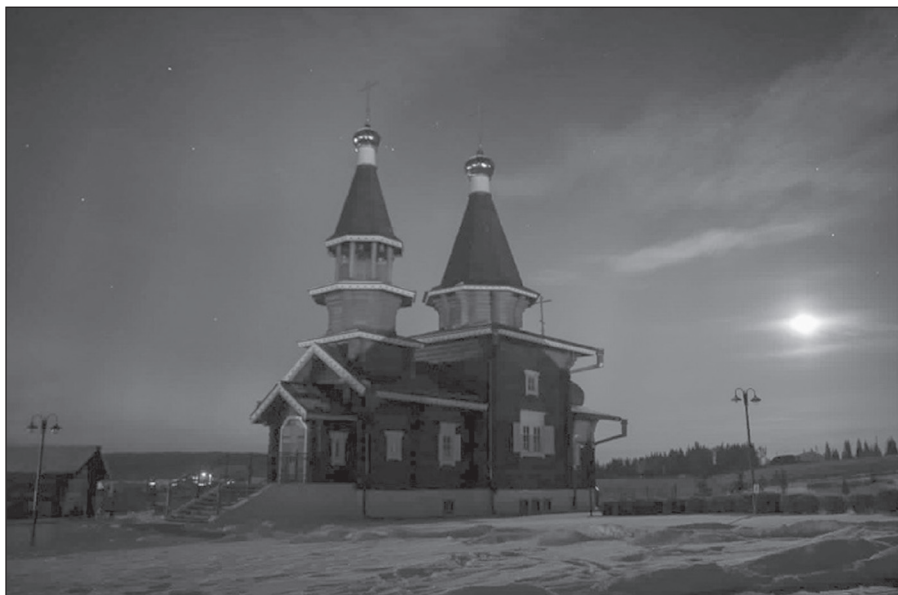
Черно-белые фото не передают краски, но небо над ангинским храмом переливается красно-зелеными сполохами

Всплеск начался 21 ноября. Количество пятен на Солнце стало стремительно возрастать (дошло до девяти групп пятен). Через несколько дней на солнечном диске наблюдались уже двенадцать групп пятен. 22 ноября из-за восточного края Солнца в южном полушарии появилась крупная группа пятен (ей был присвоен номер 13500) со сложной конфигурацией магнитных полей.