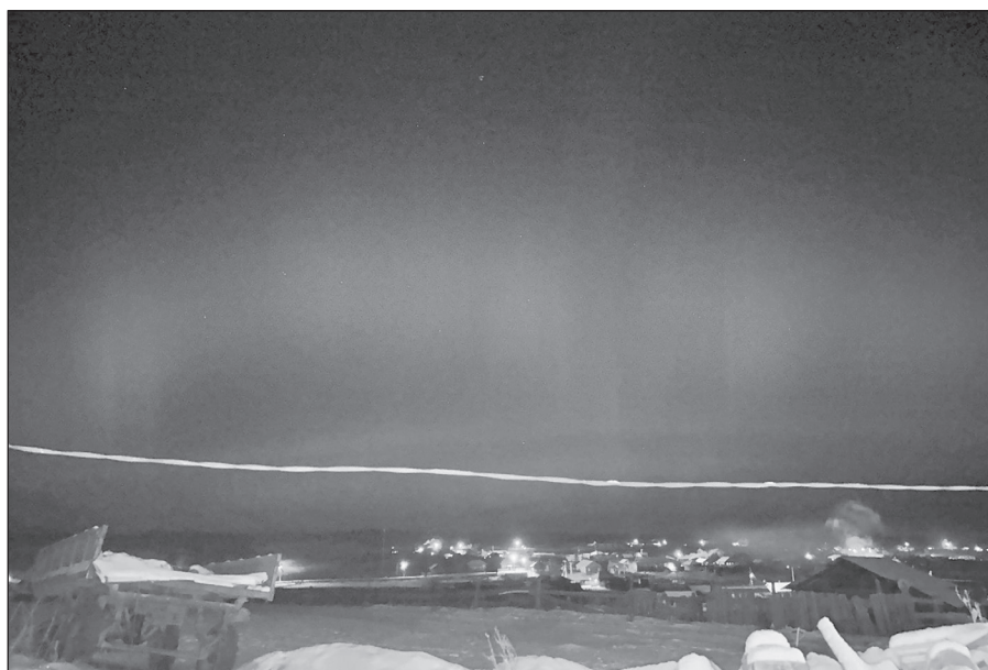
Над деревней Аргун красное зарево

По мере того, как Солнце поворачивалось, вращаясь вокруг своей оси, эта активная область оказалась на центральном меридиане светила - как раз напротив Земли.