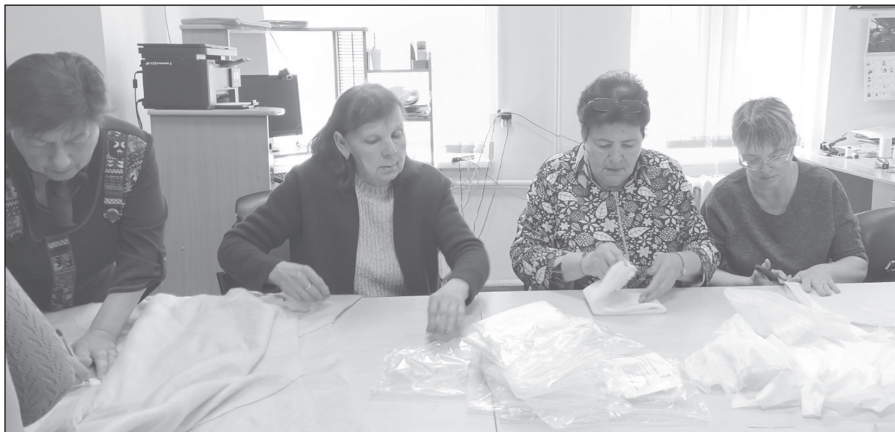
Когда работаешь с душой, и дело спорится