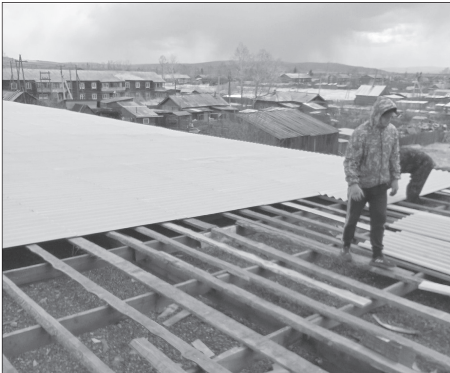
Работы по замене кровли выполняют местные мастера