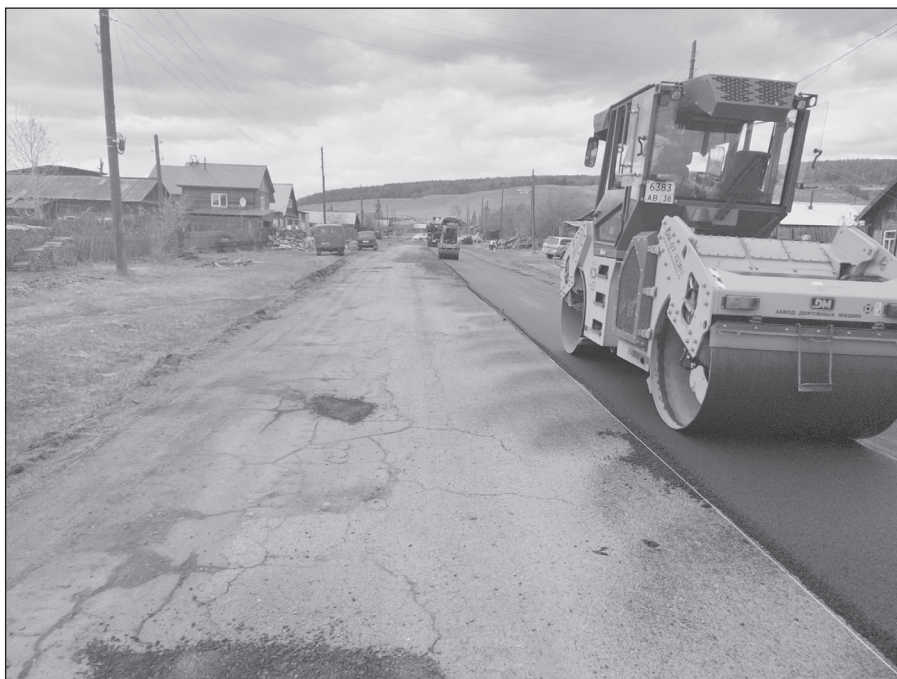
3 миллиона 145 тысяч рублей направлено на ремонт улицы Пушкина