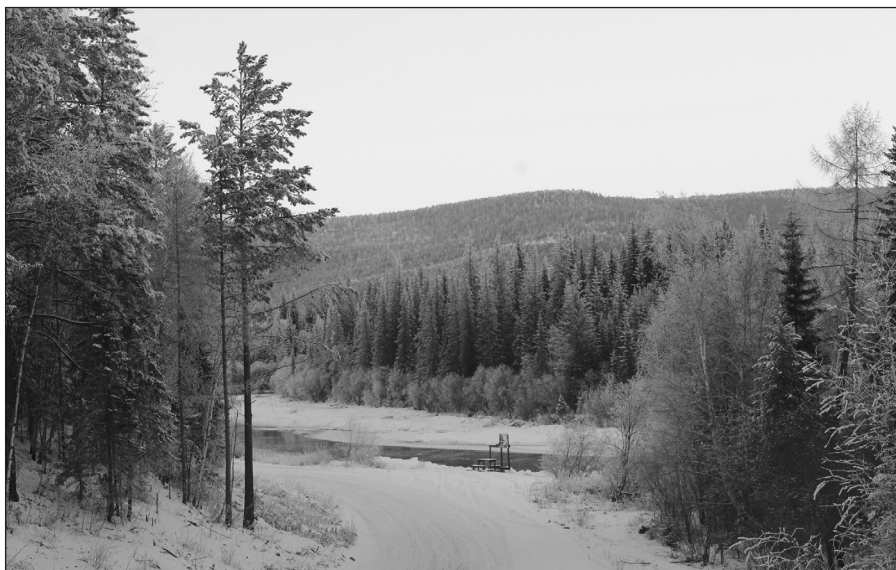
Жизнь в Большой Тарели радует красотой окружающей природы, но людям не хватает благ цивилизации