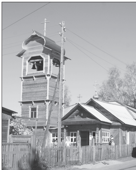
Прежнее здание храма по ул. Каландарашвили, 89