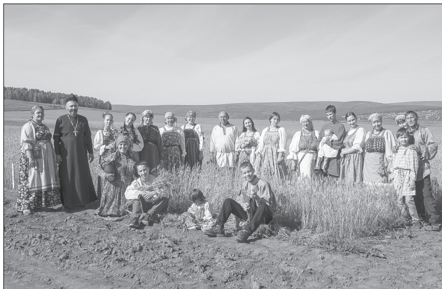
Этнолагерь, 2018 год