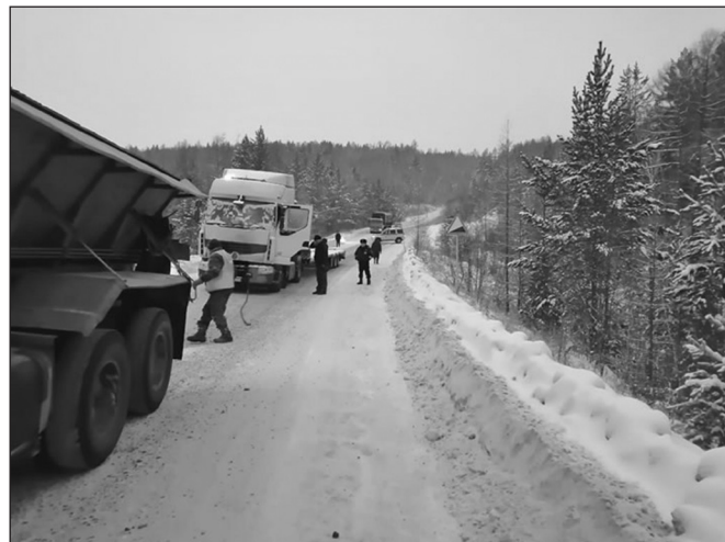
Остаться на морозе в заглохшей машине - такого и врагу не пожелаешь