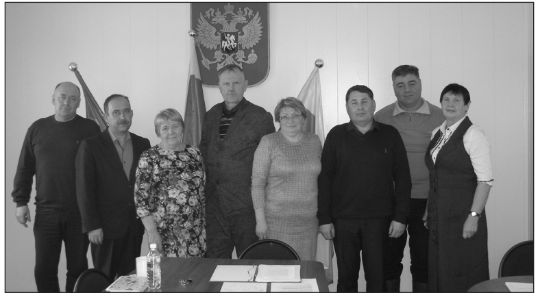
Депутаты четвертого созыва