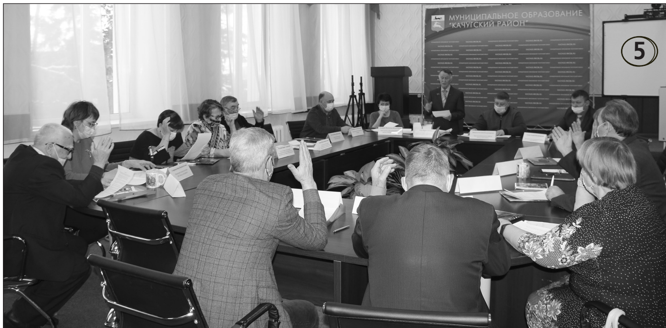
На первом в наступившем году заседании президиума районного совета ветеранов обсуждали необходимость вручения подарков детям войны к празднику Великой Победы