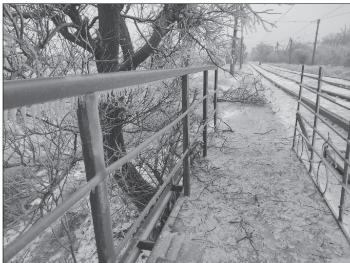
В ледяном плену