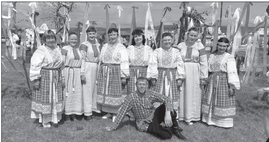
Залогские артисты на областном празднике Троица в селе Анга