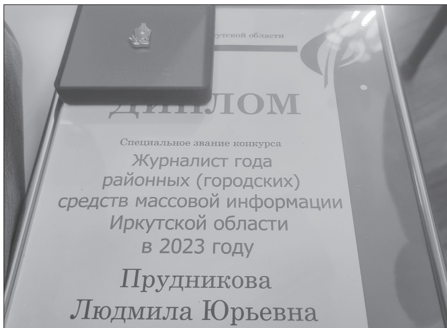
А перо, действительно, золотое, весит три грамма