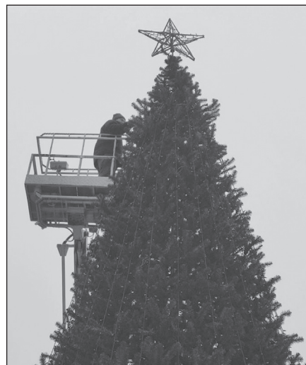
Ёлка - главный символ праздника