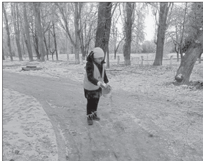
Не подсыпешь - не пройдешь

Многие из нас считают, что жизнь в небольшом районном центре, да ещё и в сибирской глубинке, скучна и бесперспективна. Где-то и зарплаты больше, и инфраструктура развита. Уеду, будет мне везде зелёный свет... Но даже если всё на новом месте будет гладко, это вовсе не значит, что вы сможете там прижиться. Понять людей с другим менталитетом не просто. В этом автор этих строк, проживающая сейчас в далекой Донецкой республике, смогла убедиться на собственном опыте.