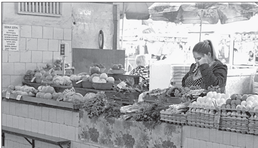
В ожидании покупателей грустят продавцы на рынках города