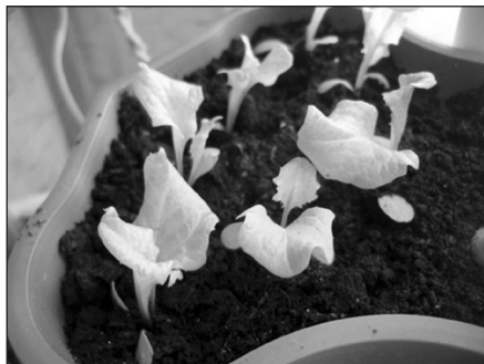
Молоденькие растения листового салата

• В-третьих, всходы салата нужно прореживать. Рекомендуется делать это дважды: через неделю после появления всходов на расстоянии 1-2 см между сеянцами, а в фазе 2-3 настоящих листьев — на расстояние 4-5 см. Если загустить посева, растения вытянутся, ослабнут, и урожая вы, скорее всего, не увидите.