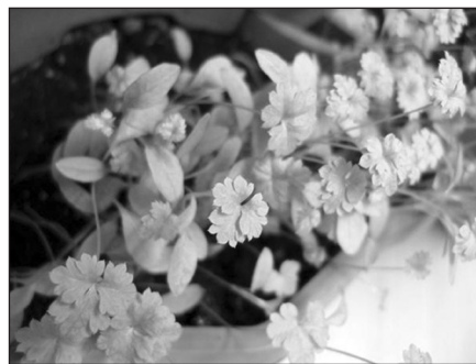
Петрушка из семян в домашних условиях

Холодов петрушка не боится, так что на подоконнике она чувствует себя отлично. Особых требований к влаге растение тоже не предъявляет — поливаем по потребности, в зависимости от условий в помещении. Я уже традиционно под все подобные посадки вношу гидрогель, поэтому проблем с поливом домашнего огорода у меня обычно не возникает вовсе.