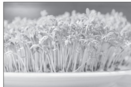
Кресс-салат — урожай через две недели

В-третьих, природа наделила кресс-салат множеством полезных свойств: регулярное употребление в пищу этой культуры помогает нормализовать кровяное давление, улучшить пищеварение и сон. Его использовали как средство от цинги, а соком лечили малокровие и авитаминозы.