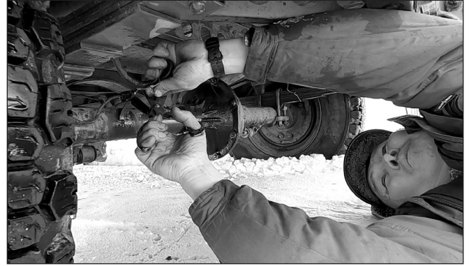
Дорожный ремонт: сначала отказали тормоза, а потом замкнула проводка