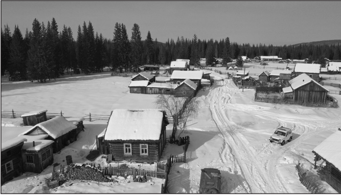
Чинонга с коптера