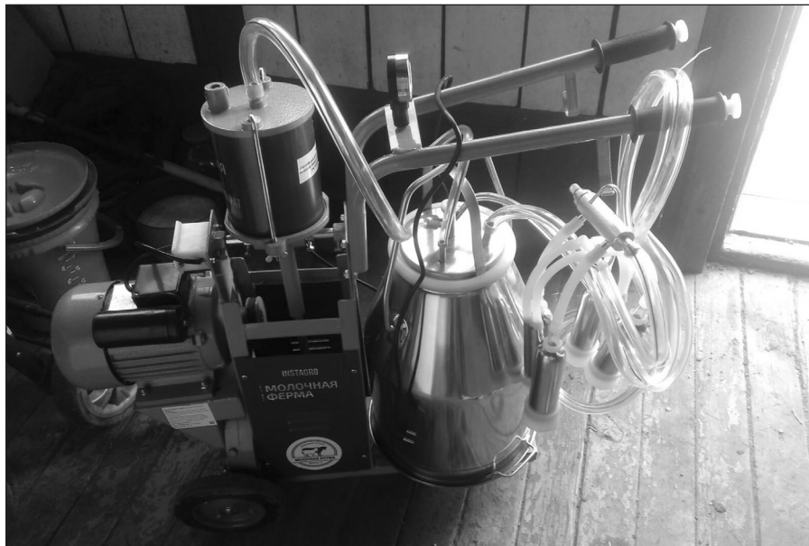
Первые заключившие в этом году социальный контракт уже начали отчитываться за выделенные средства. Людмила Соколова из села Анга приобрела дорогостоящий доильный аппарат для своего личного подсобного хозяйства

Управление социальной защиты населения по Качугскому району приглашает всех желающих заключить социальные контракты! Дополнительную информацию можно получить по телефонам: 8 (39540) 31-1-11 и 31-2-07, а также в ходе личного приёма в Управлении в кабинете №10.