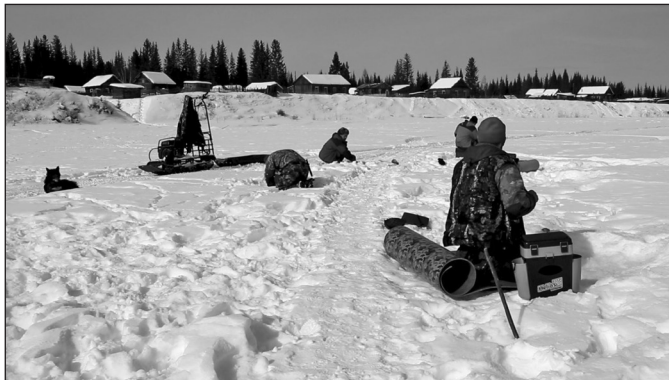
На льду Киренги преимущественно приезжие