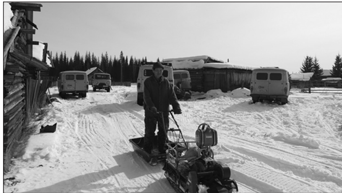
«Мотособака» - основной транспорт в Чинонге