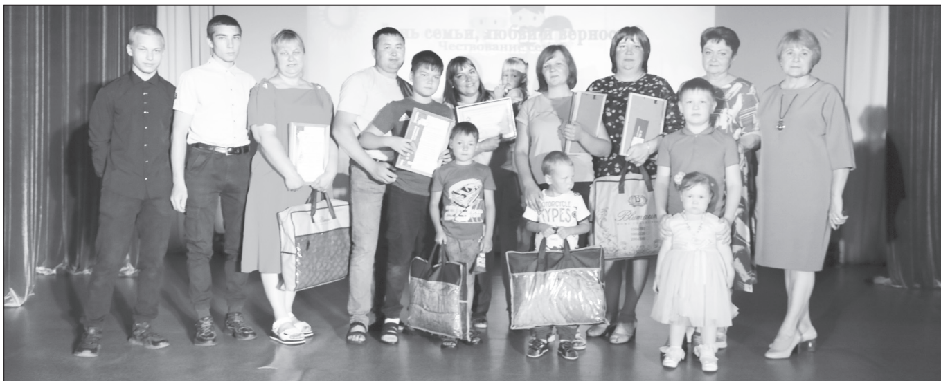
На сцене многодетные семьи Качугского района