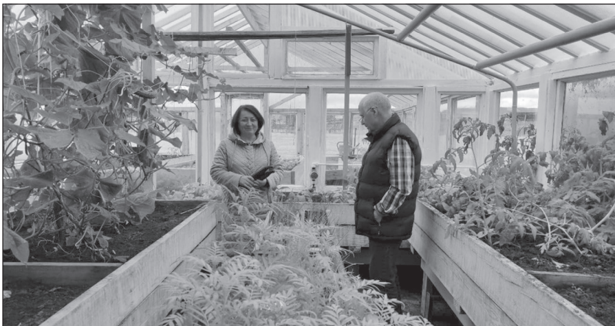
Теплица Залогской школы

Во время семинара жителям рассказали о том, какие виды сельхозкооперативов бывают, какие шаги необходимо предпринять для их создания, из чего складывается экономика организации и на какие меры поддержки от государства она может рассчитывать. Для поддержки аграриев на селе в Центре «Мой бизнес» создан Центр компетенции в сфере