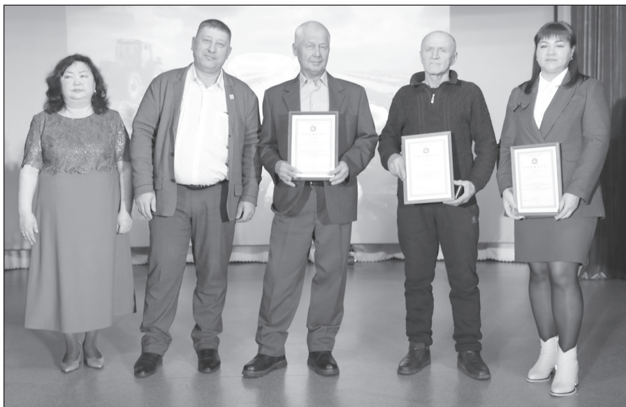
Награждение в номинации «Лучший пчеловод»