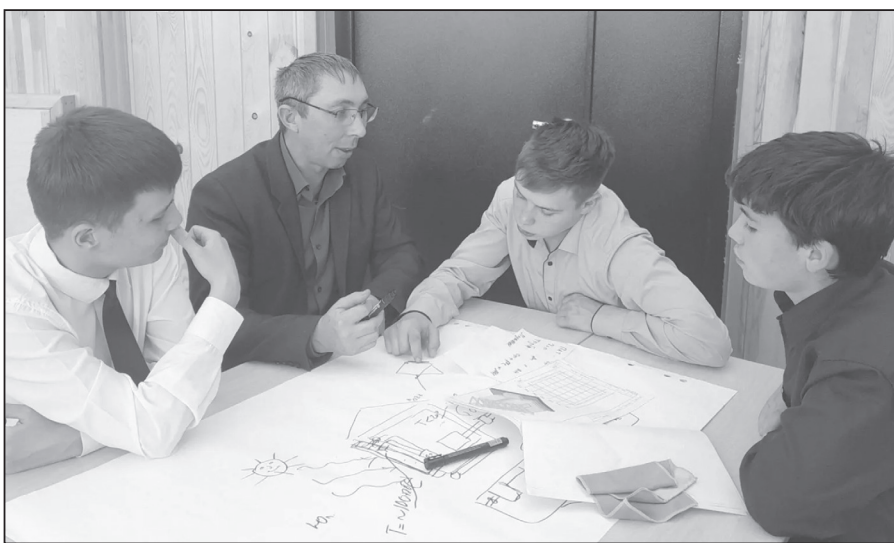
Залогцы обсуждают вопрос создания сельхозкооператива

сельскохозяйственной кооперации и поддержки фермеров.