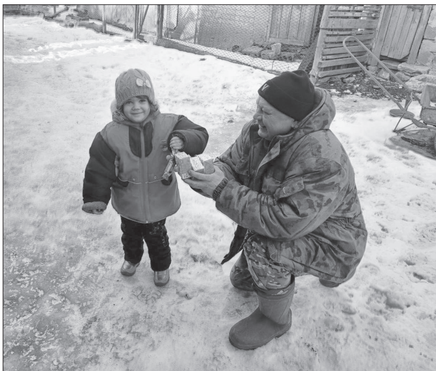
Русский солдат ребёнка не обидит

- Очень рада, что российские военные пришли к нам. Верю, что скоро жизнь наладится, и мы смо-