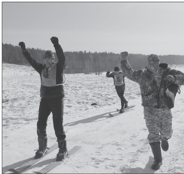
Силы дает поддержка напарника