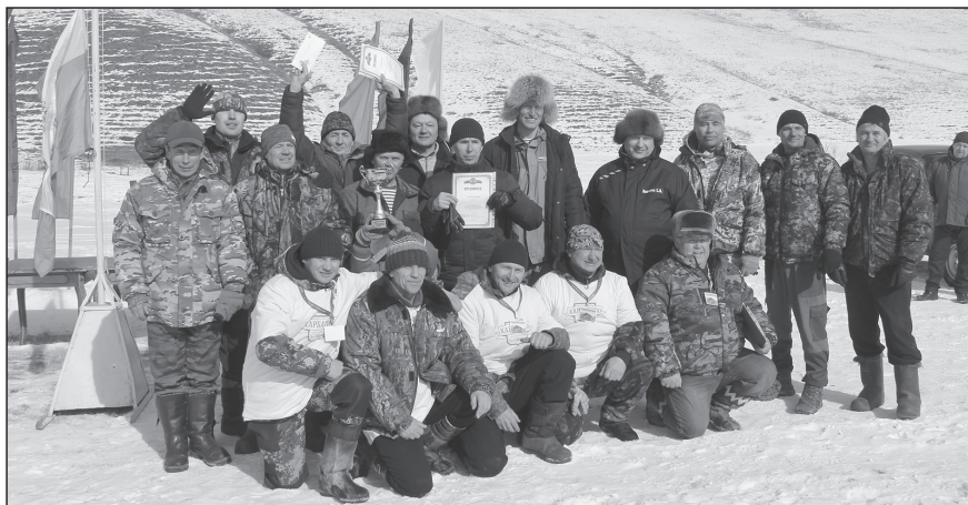
Лучшие команды биатлона-2023: СССР, Харбатовский ПОК, ДПКМ!

По результатам Охотничьего биатлона-2023 «Лучшей командой», как и в прошлом году, стала сборная СССР.