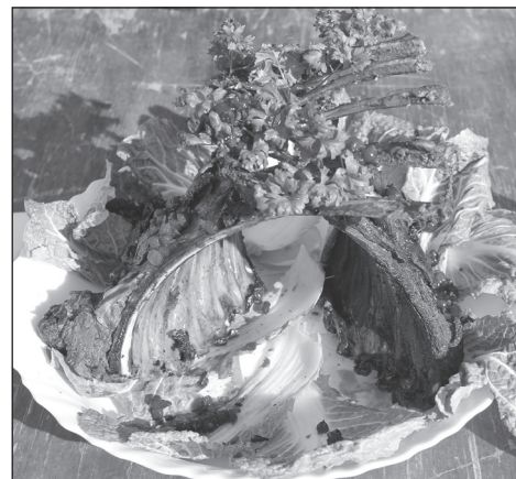
«Рай в шалаше» - блюдо команды «Кочемар» из Анги