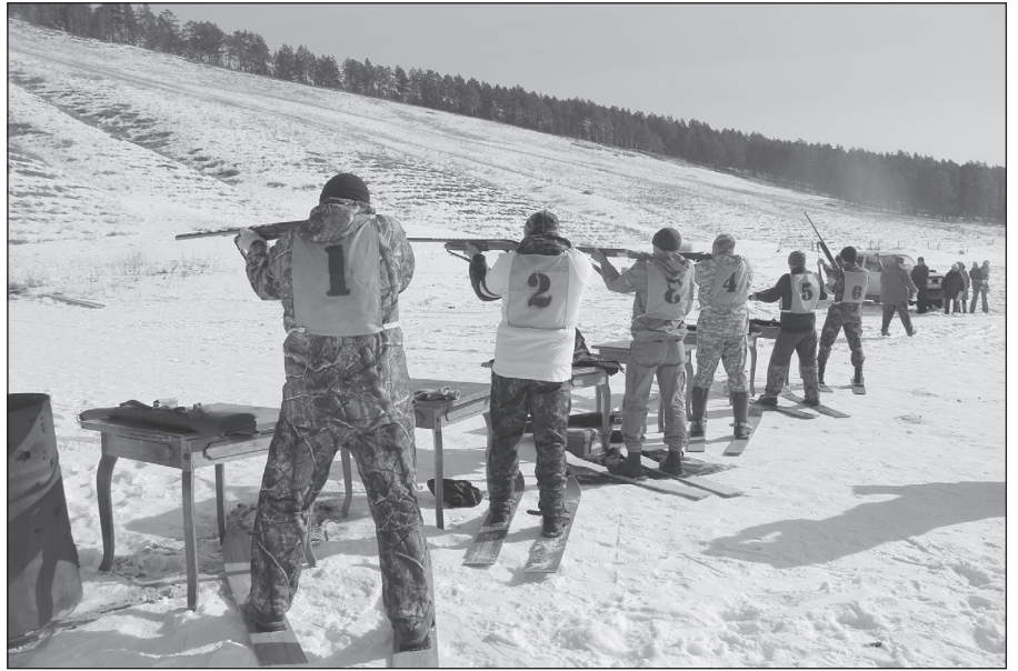
Шесть команд охотников-любителей приняли участие в соревнованиях

Уникальные, захватывающие, не имеющие аналога в других районах области соревнования по охотничьему биатлону прошли в Качугском районе 11 марта в тринадцатый раз.