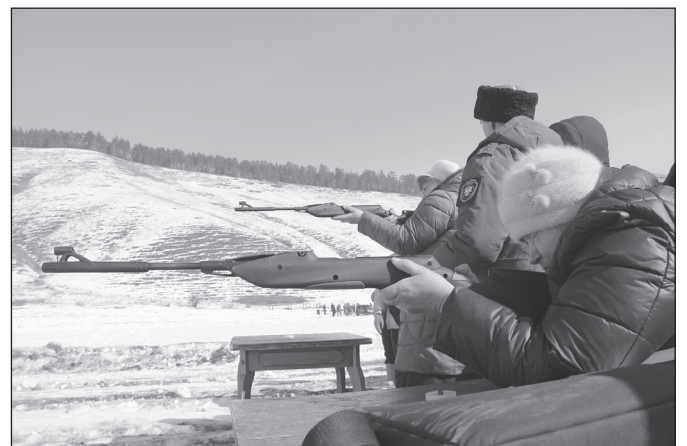
Стрельба из воздушки - новая номинация конкурса для женщин и детей