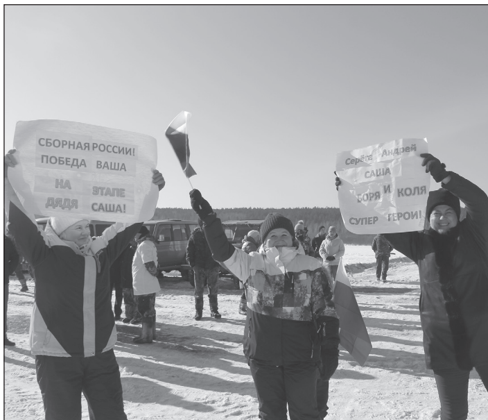
У сборной «России» самые активные болельщики