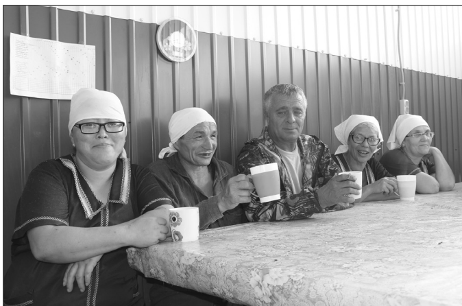
Липатовы считают, что собрали у себя на ферме передовиков со всех окрестных хозяйств