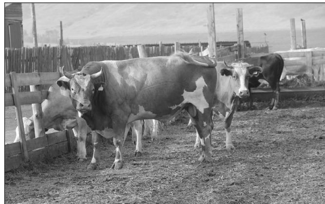
Несмотря на устрашающий вид, бык-производитель Василёк на ферме ведет себя спокойно. Вечером, как теленок, любит пить молоко