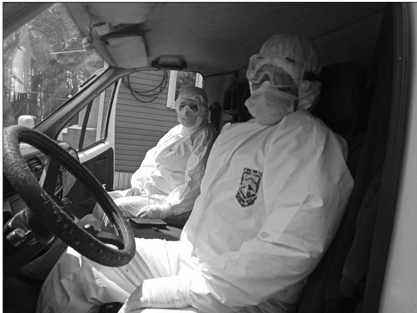
Будни медиков районной больницы в период пандемии коронавируса