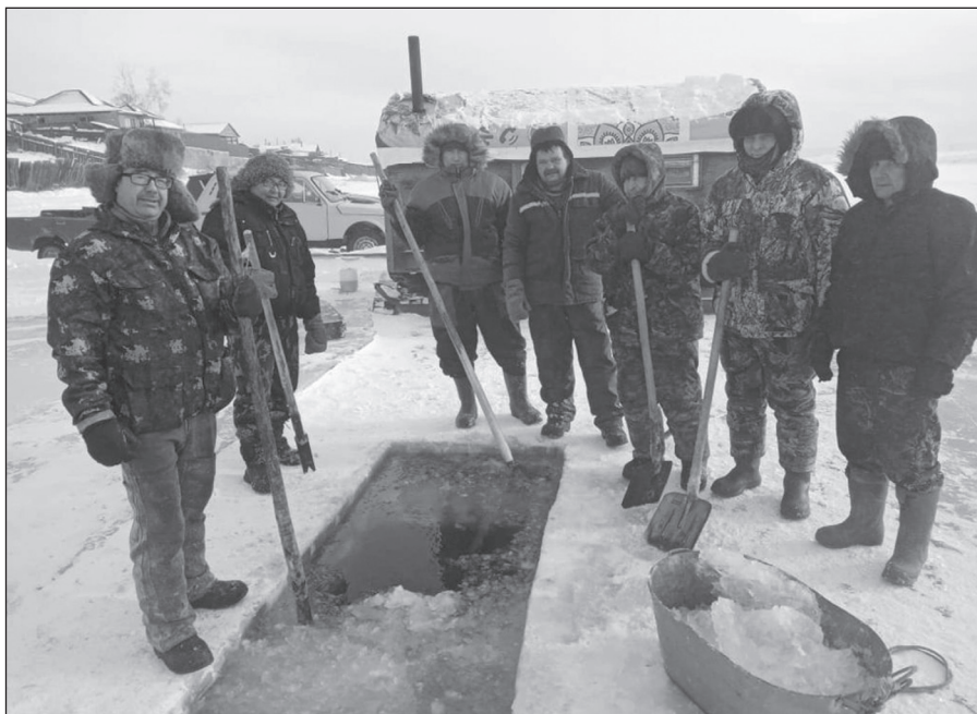
Казачи и специалисты администрации поселка 4 часа в метель пилили лед на реке