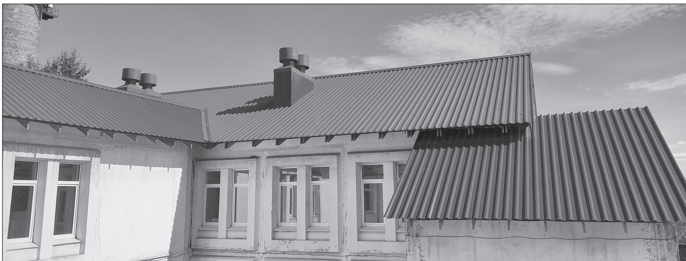
В детском саду «Радуга» в 2023 году пройдет второй этап ремонта