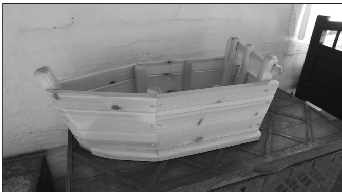
Макет карбаса получился неудачным, считает Трапезников