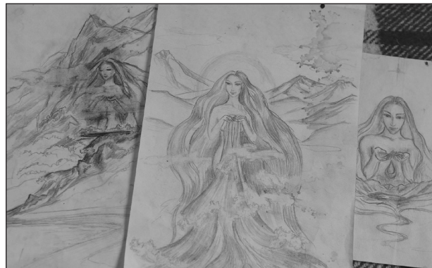
Эскизы памятника реке Лене