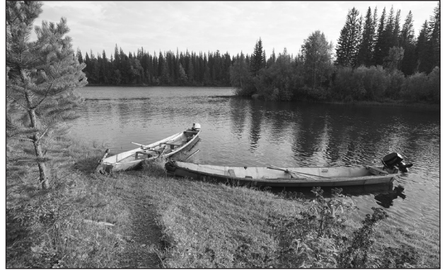
Лодки - основной вид транспорта