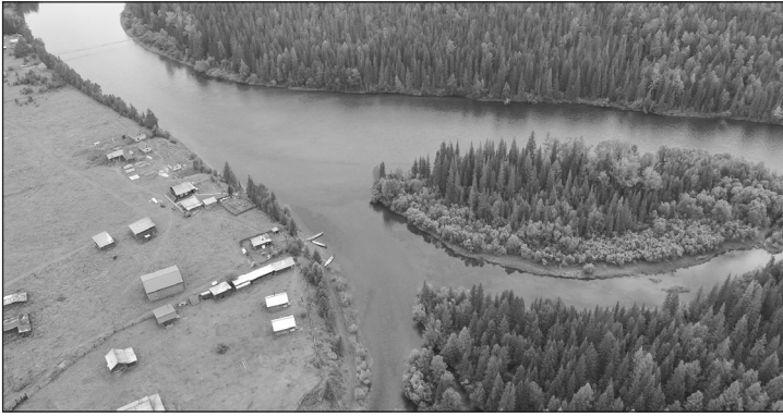
Место, где Чанчур впадает в Лену