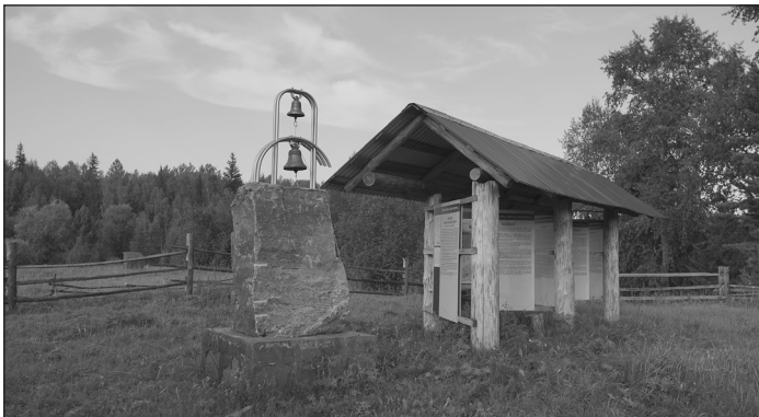
Памятник Курбату Иванову