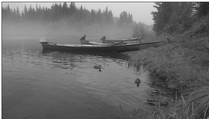
В предрассветной тишине непуганая стая диких уток подплыла практически на расстояние вытянутой руки