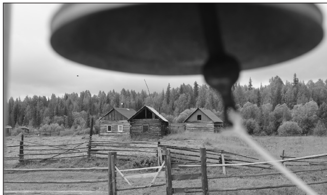
Колокола отливали по спецзаказу