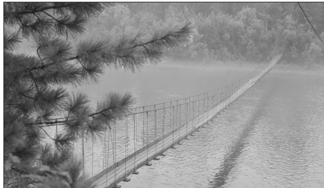
Подвесной водомерный мост — визитная карточка Чанчура