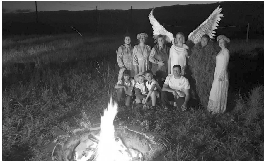
В съёмках клипа приняли участие родные автора баллады, артисты и жители Приленья. Снимали в Чанчуре, Курунгуе, Малой Тарели, Залого, Болото, Анге и Щапова