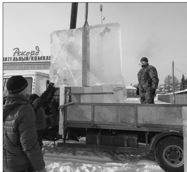
43 глыбы льда, каждая по 800 кг, заготовлено для строительства горки у ФОКа