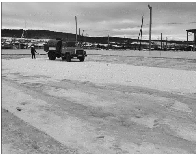
Заливка катка без спецтехники