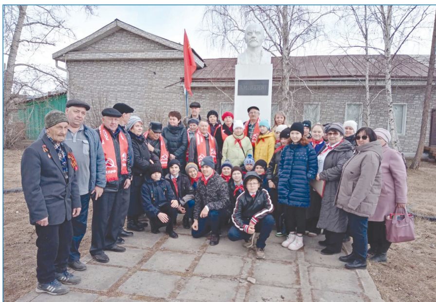
В день рождения В.И. Ленина 13 октябрят Качугской школы №1 вступили в пионеры