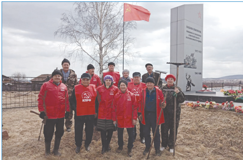
На субботнике у обелиска