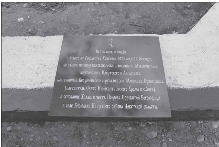
При строительстве храмов наличие в основании четырехугольного камня обязательно