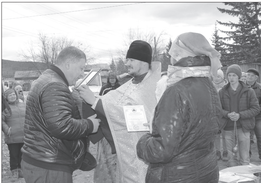
Всем помощникам батюшка подарил иконы Покрова Пресвятой Богородицы