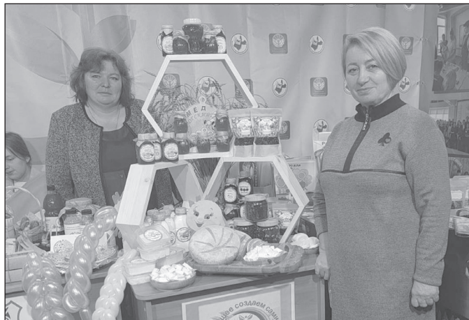
Постоянные участники Агропромышленной выставки в Иркутске - команда Залогской школы