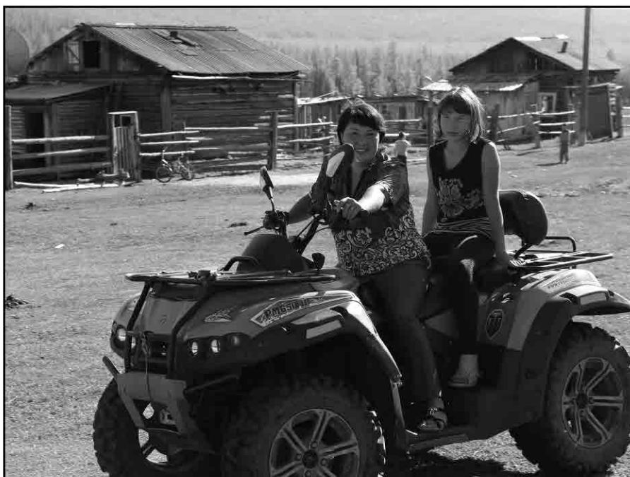
Квадроциклы эвенки приобретают не забавы ради. Летом лишь на внедорожнике или верхом на коне можно добраться до большой земли. Болотистые почвы охраняют охотничьи общины.