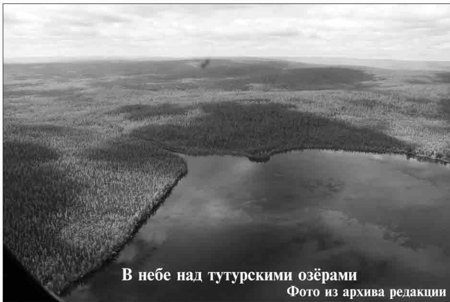
В небе над тутурскими озёрами