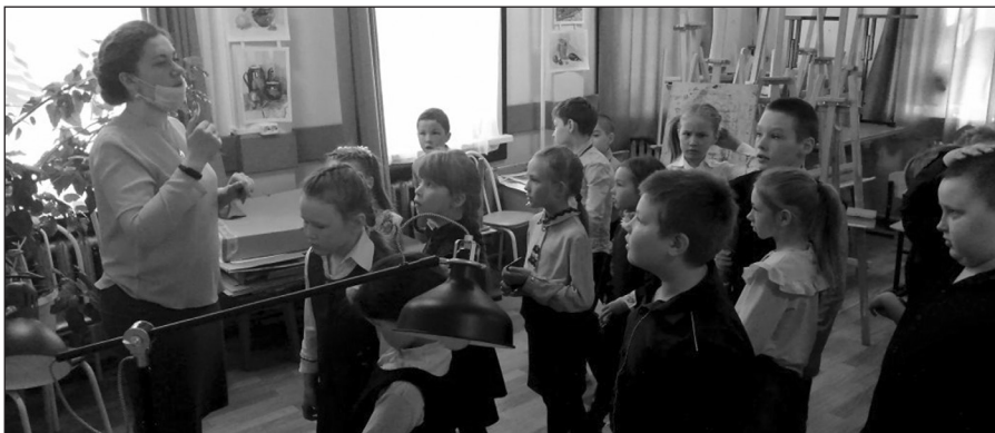
Профоринтационная экскурсия в художественной школе, май 2021

• Онлайн выставка творческих работ «Украшению планеты посвящается!»;