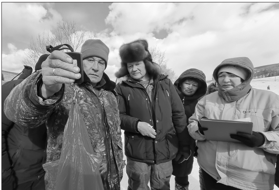
Регистрация результатов - дело ответственное