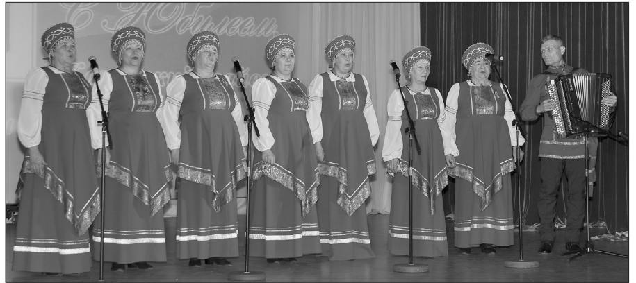
На юбилейном праздничном концерте выступает ансамбль «Ленские голоса»

В сфере культуры района трудится 143 специалиста: клубников - 80, библиотекарей - 42, преподавателей дополнительного образования - 21 человек. С высшим и средним профессиональным образованием - 96%. В 2021 году проведено 4008 мероприятий клубного типа. Кружков и объединений в клубах и Домах культуры нашего района насчитывается 162. У нас семь народных коллективов, один образцовый. В 2021 году Лауреатами международных фестивалей стали шесть коллективов, Всероссийских фестивалей и конкурсов - восемь, областных - 21.