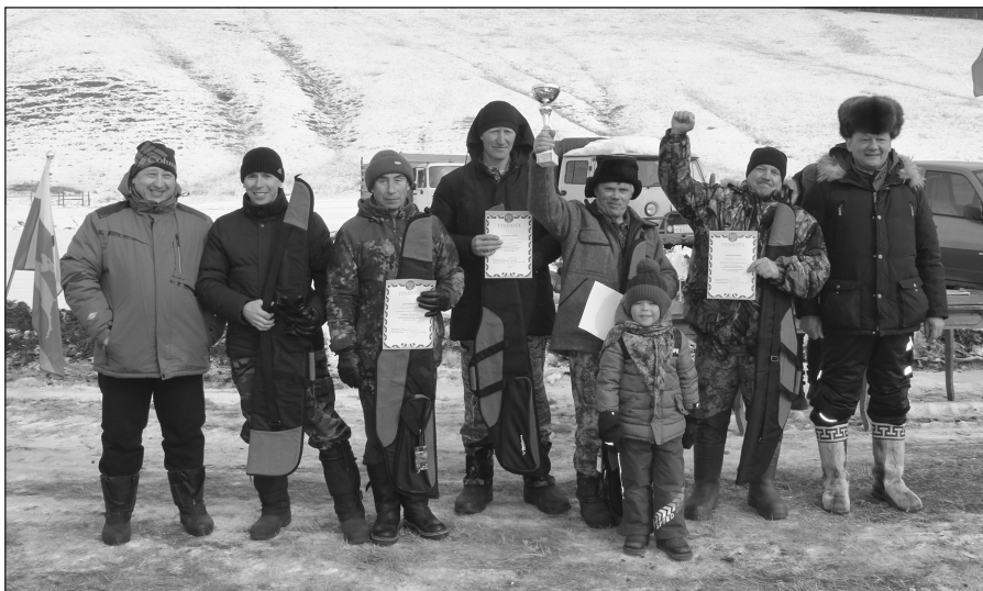
В СССР всем хорошо! Учтивая результаты команды, лозунг вполне актуален