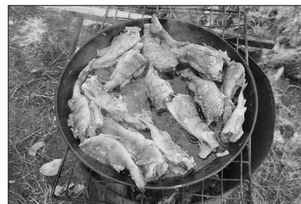
Участников рыбалки манил аромат копченого, жареного