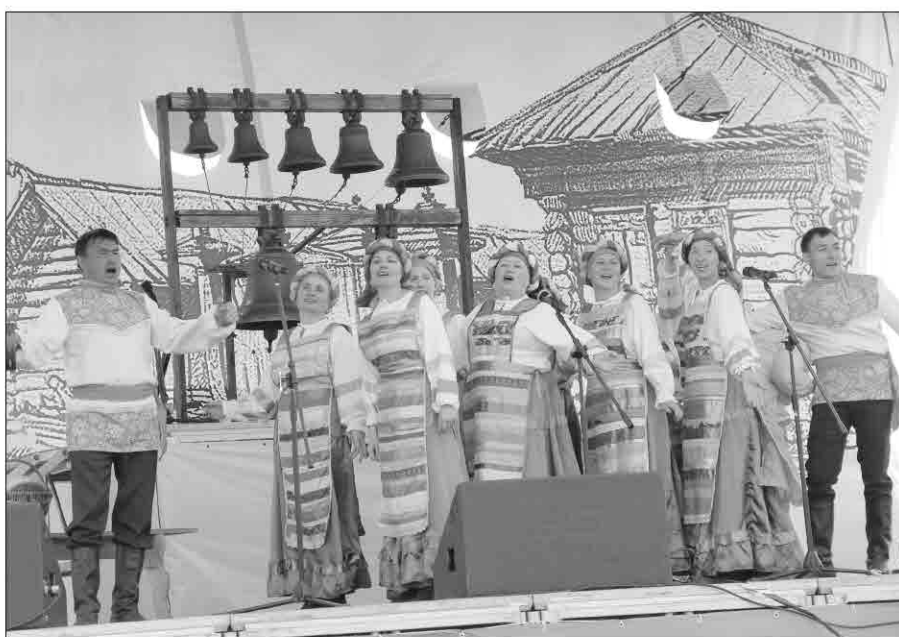
Одним из первых программу фестиваля «Ангинский хоровод» открыл местный ансамбль «Селяночка»

Кульминацией дня стало открытие международного этнокультурного фестиваля «Ангинский хоровод». Многообразие национальных творческих коллективов, хореографические, вокальные и фольклорные ансамбли, высокий уровень исполнительского мастерства... Зрительские трибуны не пустовали до позднего вечера.