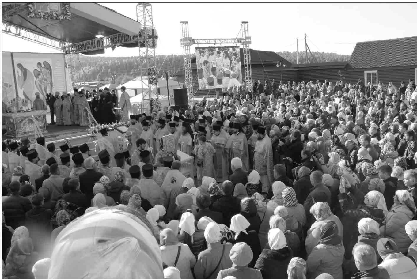
Священнослужители и православные христиане с раннего утра на службе в Анге