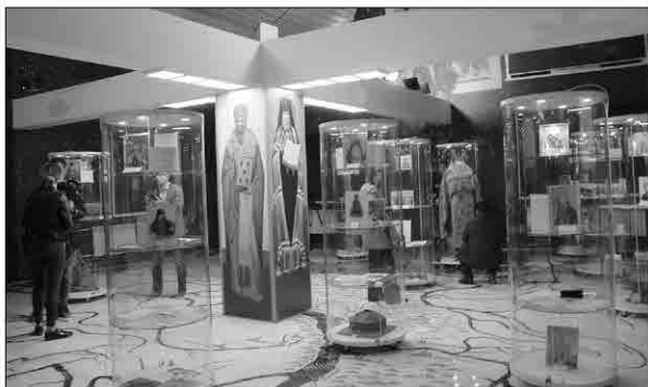
Экспозиции внутри КПЦ