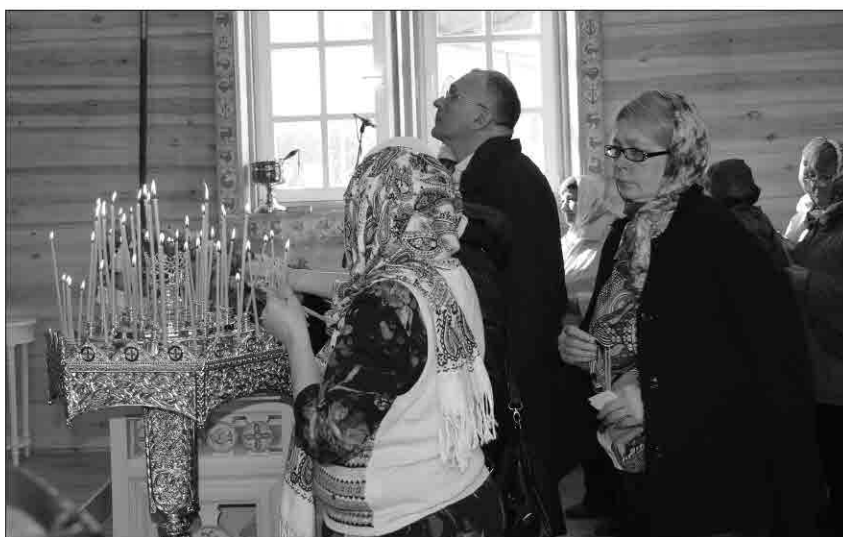
В храме люди заказывали Сорокоуст о здравии, ставили свечи