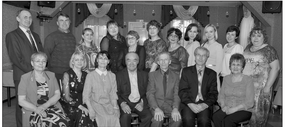
Коллектив школы с педагогами-ветеранами

кальной школы или другой школы искусств является образовательная, но в наше стремительно бегущее время функции школы намного расширились. За последние пять лет на базе школы организованы и проведены следующие мероприятия: межрайонный вокальный конкурс «Музыка нас связала», районные конкурсы «Качуг-Голос-Дети» и «Мисс музыка», школьные «Музыкальный КВН», «Весеннее настроение» с участием семейных дуэтов. Прошли тематические беседы по этикету для мальчиков «Я музыкант и джентльмен», «Этикет для девочек», ежегодные торжественные линейки к началу и окончанию учебного года, новогодние праздники, отчетные концерты, день самоуправления. Преподаватели участвовали в районных и поселковых мероприятиях «100-летие Октябрьской революции», «100 лет ВЛКСМ», в концертах Года культуры, вечере японской культуры. Поддерживаем Всероссийские и областные акции: «Ночь искусств», ежегодную хоровую «День славянской письменности и культуры». В 2017 году 70 наших ребят участвовали в Открытии I международного этнокультурного фестиваля «Ангинский хоровод» в селе Анга. Преподаватели участвуют в конкурсах педагогического мастерства. Для преподавателей детских школ искусств нами организован и проведён межрайонный дистанционный конкурс «Портфолио педагога», где участвовали Ольховская, Усть-Ордынская, Баяндаевская, Жигаловская и Качугские школы.