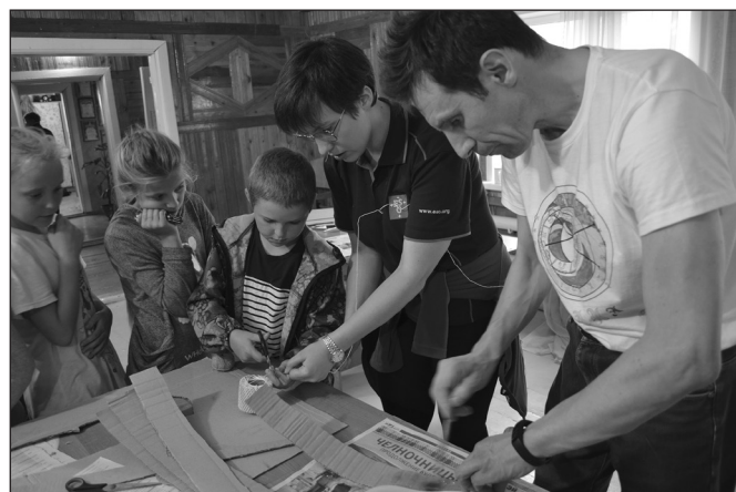
А пока ребята делают простые телескопы своими руками