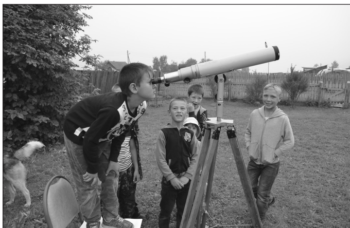
Скоро в Белоусово появится свой большой телескоп