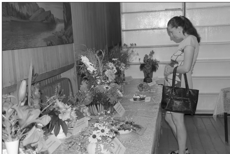
15 композиций приготовили для выставки участницы женского клуба «Лена»