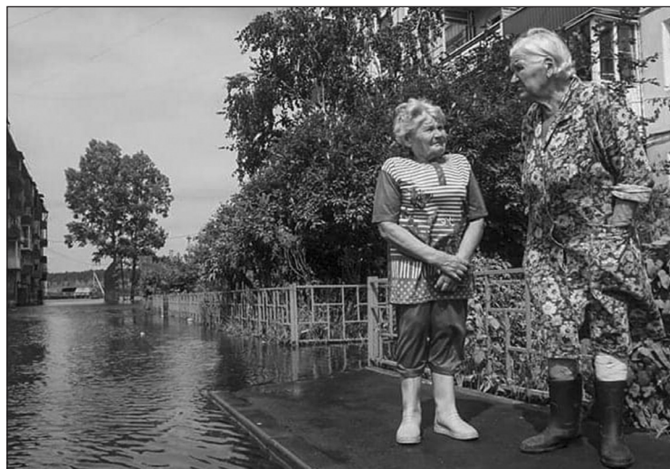
Пострадавшими в результате наводнения в Иркутской области признаны 45 тысяч человек