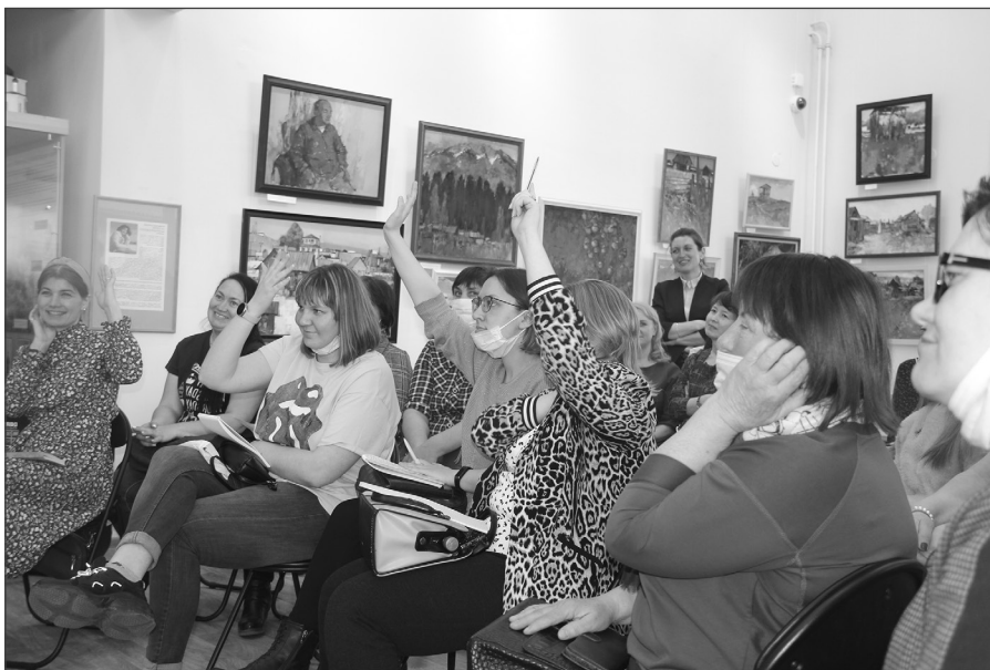
В разгаре обсуждений: голосуем за развитие