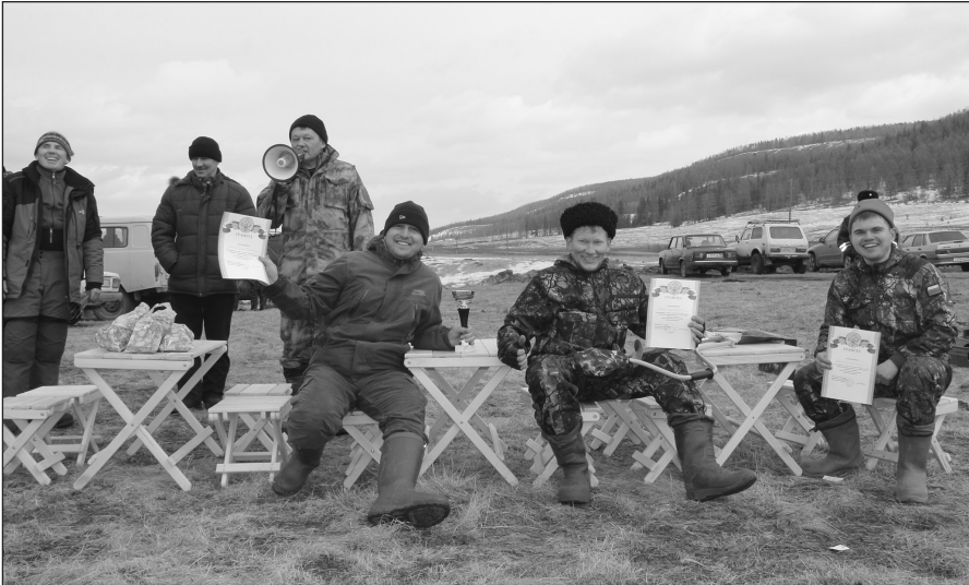
«Сибирские партизаны», команда качугцев - лучшие рыбаки