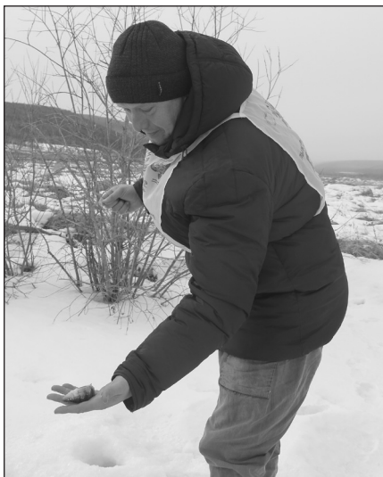
Первая рыбка поймана на третьей минуте турнира