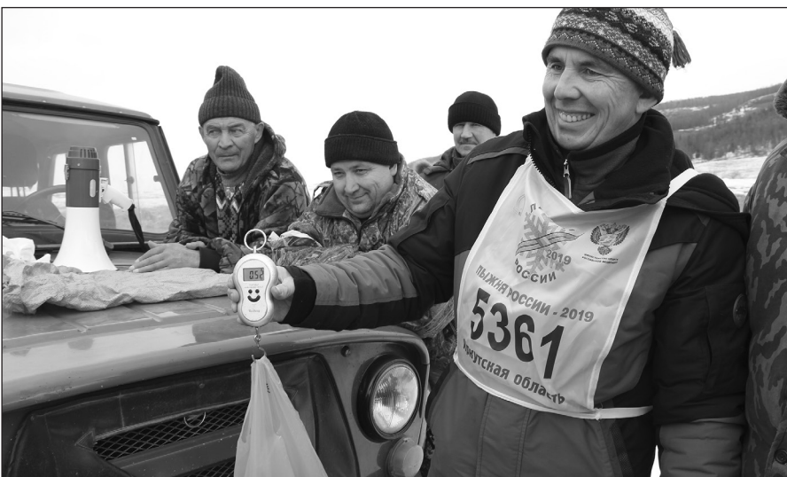
Контрольное взвешивание улова проходит каждый участник