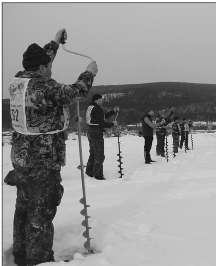
В конкурсе «Бурение лунки на скорость» три призовых места