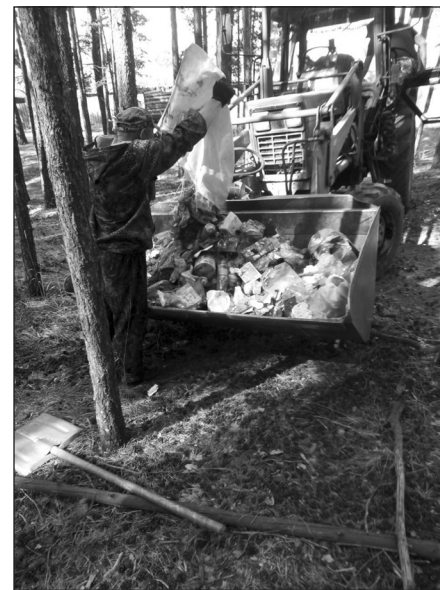
Несанкционированную свалку убрали рабочие администрации посёлка