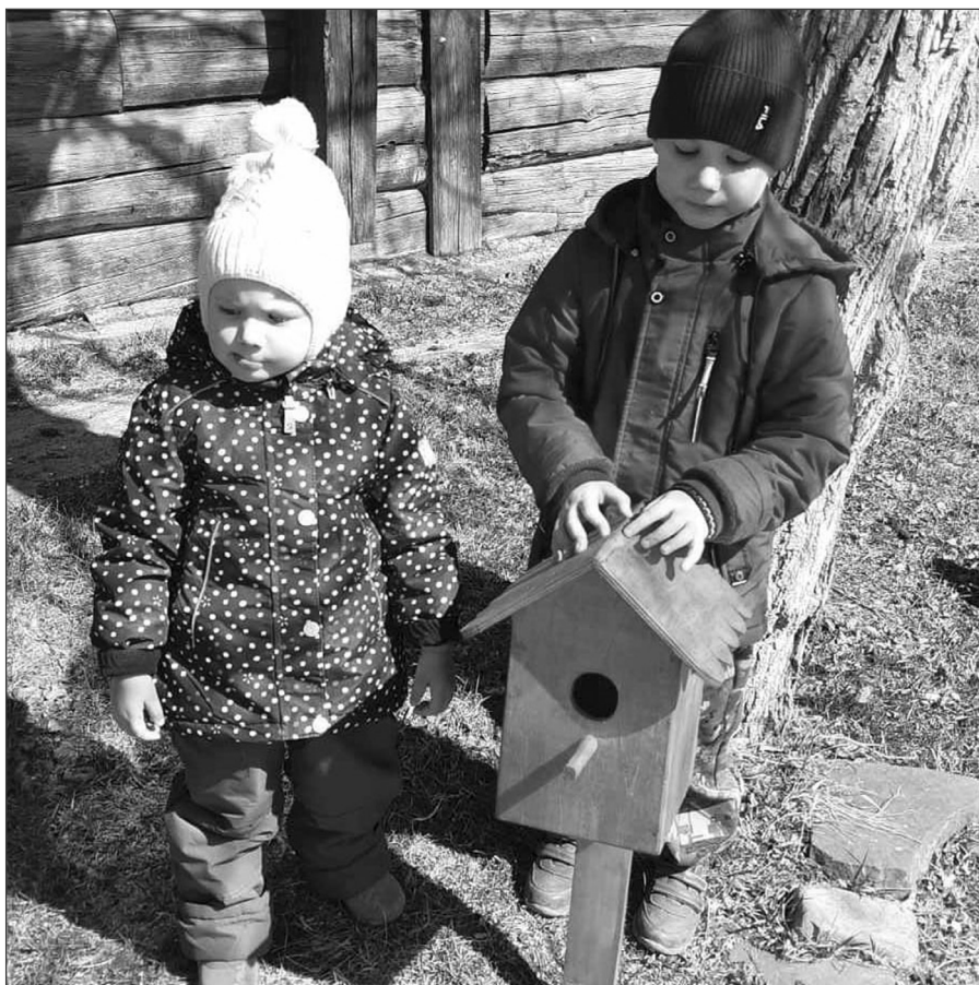
Участники акции «Подари птичкам домик», д. Тимирязева

Работники Ангинского культурно-информационного центра стали аудиогидами в программе «Мой край родной», в которой провели экскурсантов по заветным местам своего села, фотоконкурс «Моя семья — моя Родина» ангинцы поддержали всецело и выложили свои самые необычные фотографии. Видеоролики о красоте нашей природы «Привет