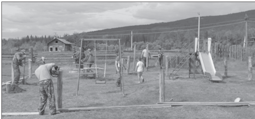
В д. Малая Тарель в 2021г. был реализован проект «Детская мечта» по установке детской площадки

С целью стимулирования граждан к поиску выхода из трудной жизненной ситуации, повышения экономической активности и качества жизни, а также формирования в сознании граждан перспективных планов устройства своего будущего ОГКУ «Управление социальной защиты населения по Качугскому району» была предусмотрена государственная социальная помощь на основании социального контракта. В рамках данного социального проекта председателем Думы было организовано пять семинаров с главами сельских поселений с целью доведе-