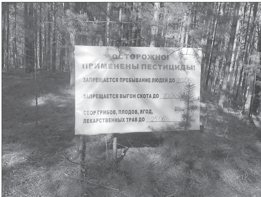
Сибирский шелкопряд повреждает около двадцати видов хвойных пород, предпочитает лиственницу, кедр, пихту

В насаждениях Качугского лесничества в период с 30 апреля по