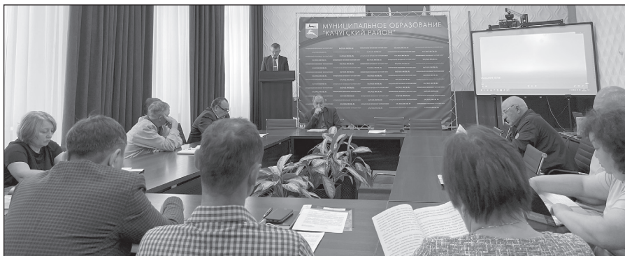
На заседании 20 мая председатель Думы отчитался о проделанной работе за 2021 год

Наиболее ярким и важным вектором нашей работы была и остаётся нормотворческая деятельность. Документы требуют постоянной