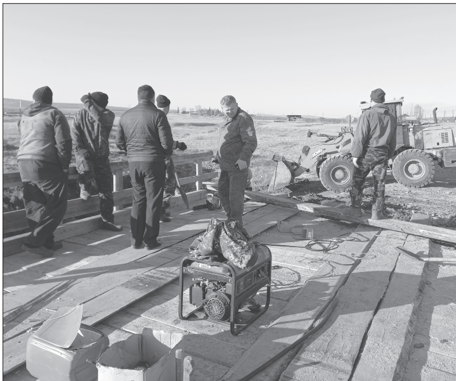
Строительство моста в урочище Чалоты Манзурского сельского поселения