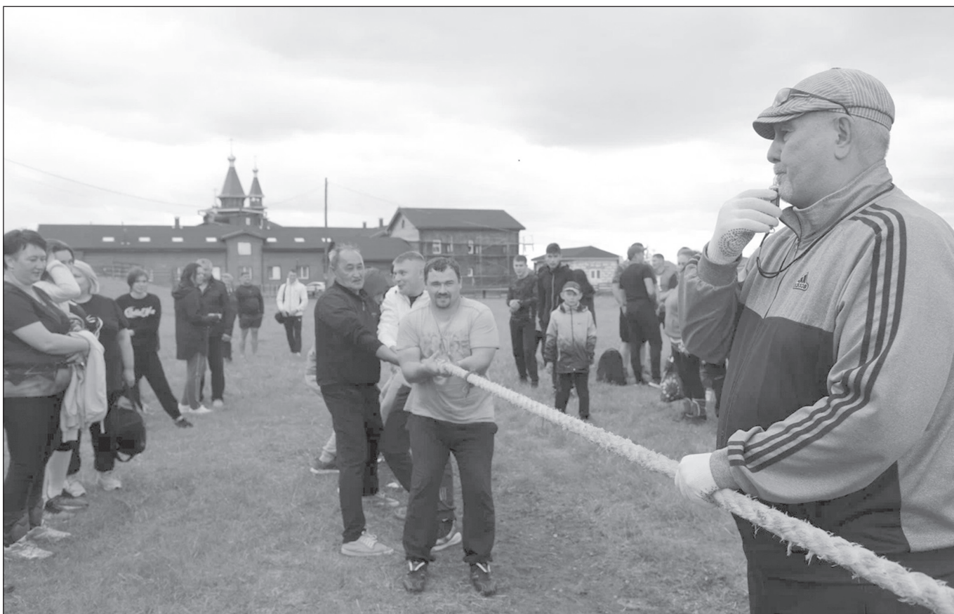
Село Анга стало местом притяжения, проведения различных культурно-массовых мероприятий

По итогам летних сельских спортивных игр Качугского района пополнились бюджеты сельских поселений, средства направят на развитие спорта