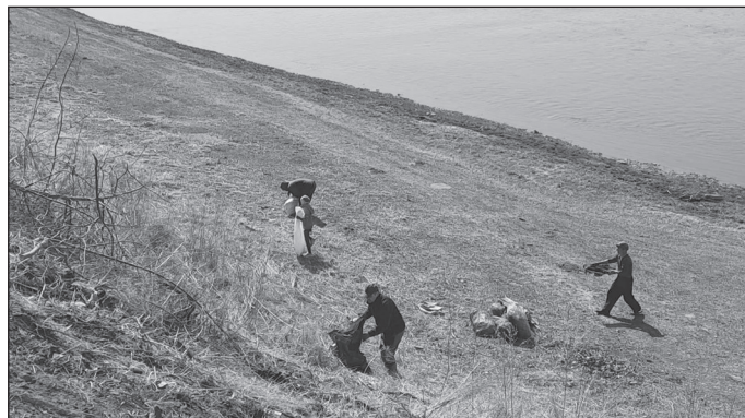
До субботника 10 минут, начало положено