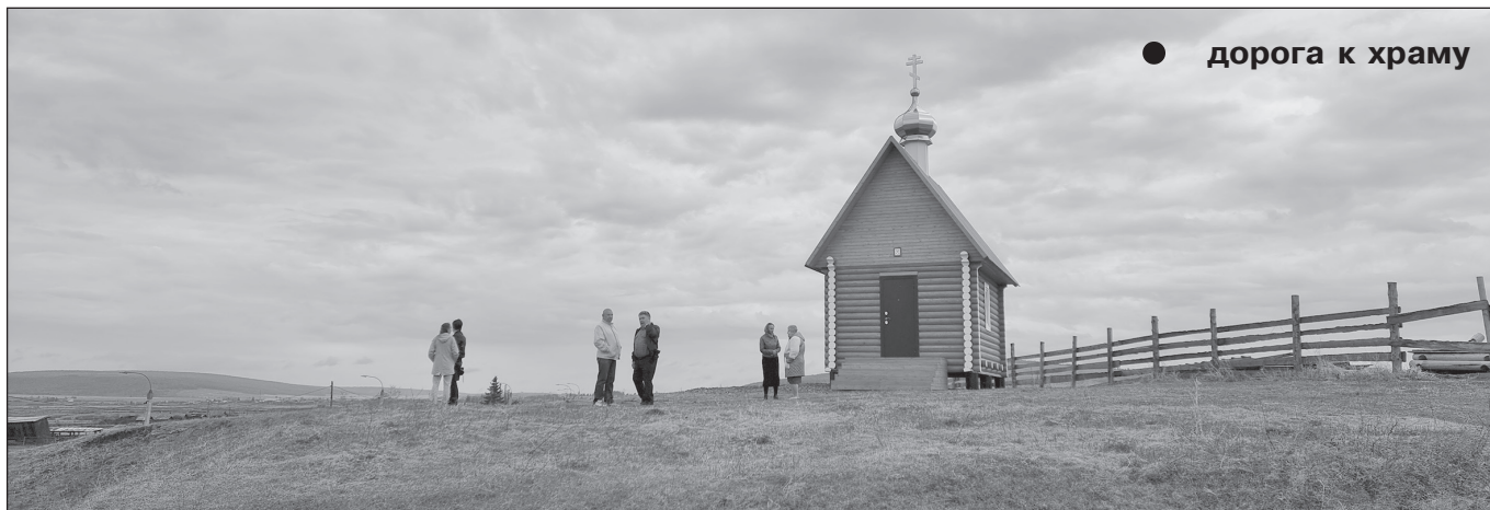
● дорога к храму