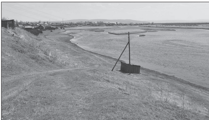
Чистый берег реки Лены