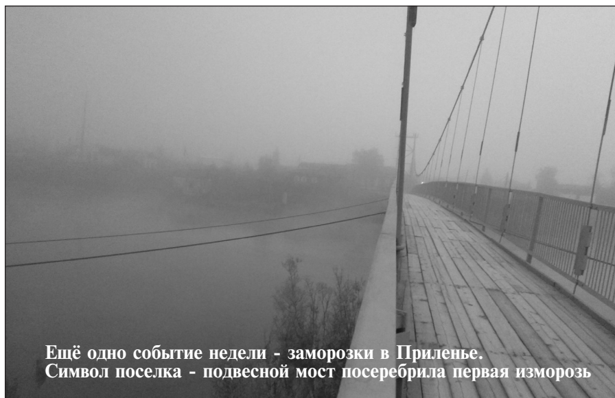
Ещё одно событие недели - заморозки в Приленье. Символ поселка - подвесной мост посеребрила первая изморозь

Обсуждая тему пассажироперевозок, население припомнило владельцам маршрутных такси все обиды: неработающие скидки, поломки автотранспорта в дороге, хамство водителей. У