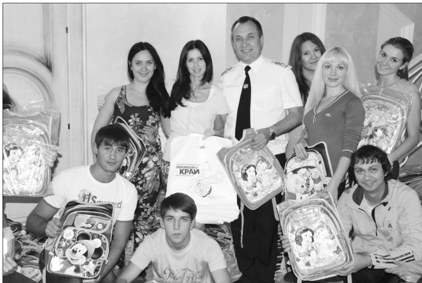
● проект «Портфель первокласснику»