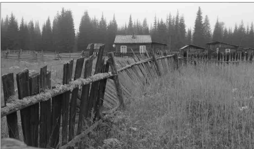
Утро в Чинонге начинается неспешно и до обеда на улице можно не увидеть никого