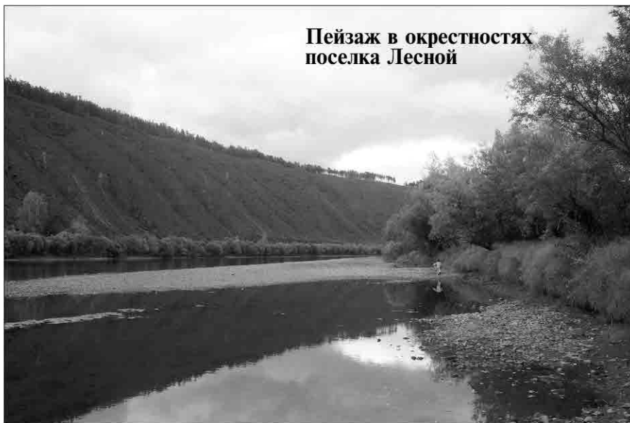
Пейзаж в окрестностях поселка Лесной

Самым красивым местом в поселении называют п. Лесной, где расположен детский оздоровительный лагерь «Лена». Но и эту «жемчужинку» люди не жалеют. Пожар вблизи п. Лесной в 2016 г. не сам возник. Аналогичный пожар полыхал в весенний период, угрожая нефтебазе, в конце 80-х. Что это? Откровенное вредительство? Кому? Сколько потребуются лет, чтобы восстановился лесной массив?! В этой связи организаторы презентации обратили внимание на десантную службу Качугского отделения ОГБУ «Иркутской базы авиационной охраны лесов», которая решает глобальные проблемы экологии и тем самым вносит значительный вклад в сохранность лесного фонда Приленья, Иркутской области и России в целом. К слову сказать, многие мужчины, работающие в этой службе, из Исети – небольшой деревни в Качугском сельском поселении. Некоторые из них уже достигли пенсионного возраста по профессиональному стажу. Труд