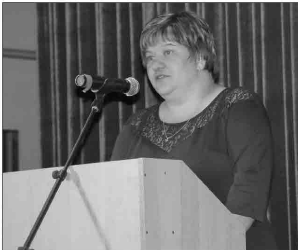
Из доклада заведующего роно Н.Г. Окуновой: «На территории района действует 36 образовательных организаций»