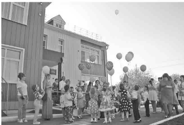
Детский сад «Тополёк» был построен в 2014 году. Здание рассчитано на 160 ребят. Есть музыкальный зал, спортзал, площадка для прогулок