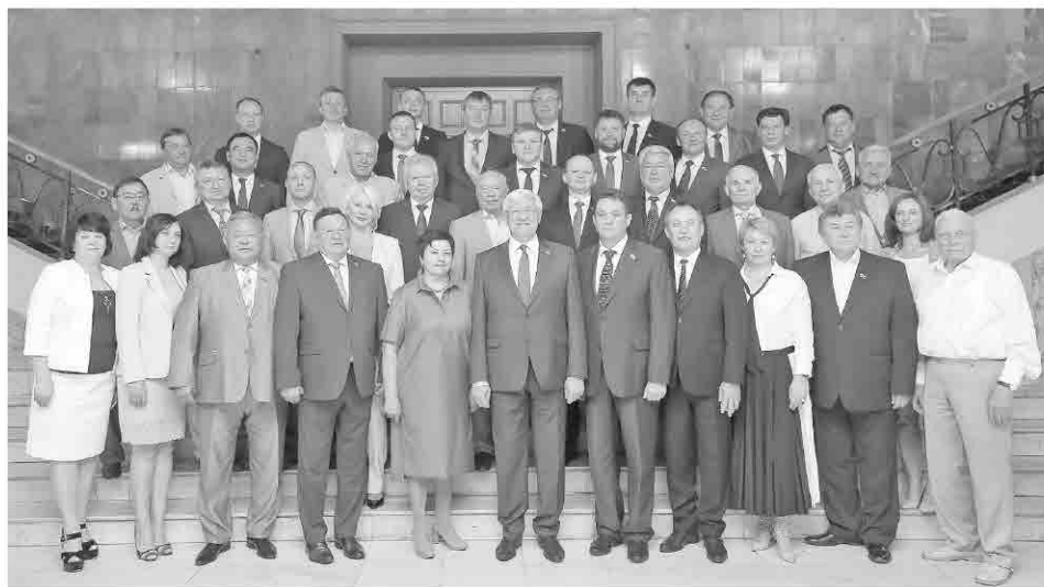
Законодательное Собрание Иркутской области второго созыва