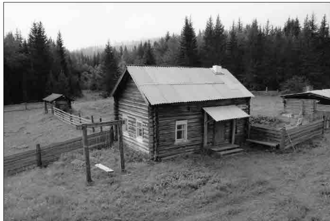
Дом, в котором родился прославленный летчик