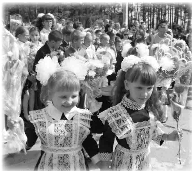
На фото из архива редакции: 1 сентября 2017г. в Качугской школе №1