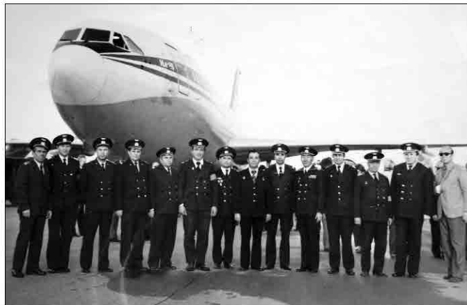
Первая посадка самолета Ил-86 в аэропорту Алма-Аты 2 октября 1979 года