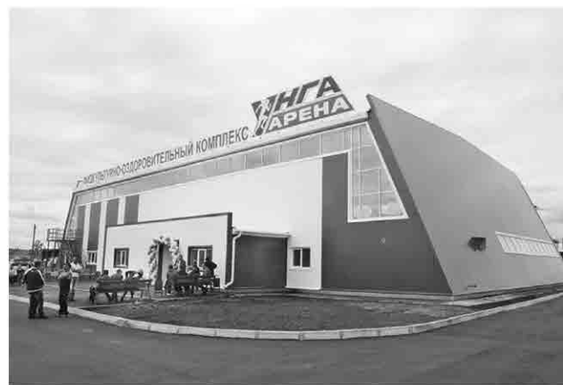
ФОК в посёлке Новонукутский: двухэтажное современное здание с залом для мини-футбола, баскетбола, волейбола

Кроме того, крошки получили и автогородок. Машины, светофоры, пешеходные дорожки, знаки учат их правилам дорожного движения с самого юного возраста. →→→