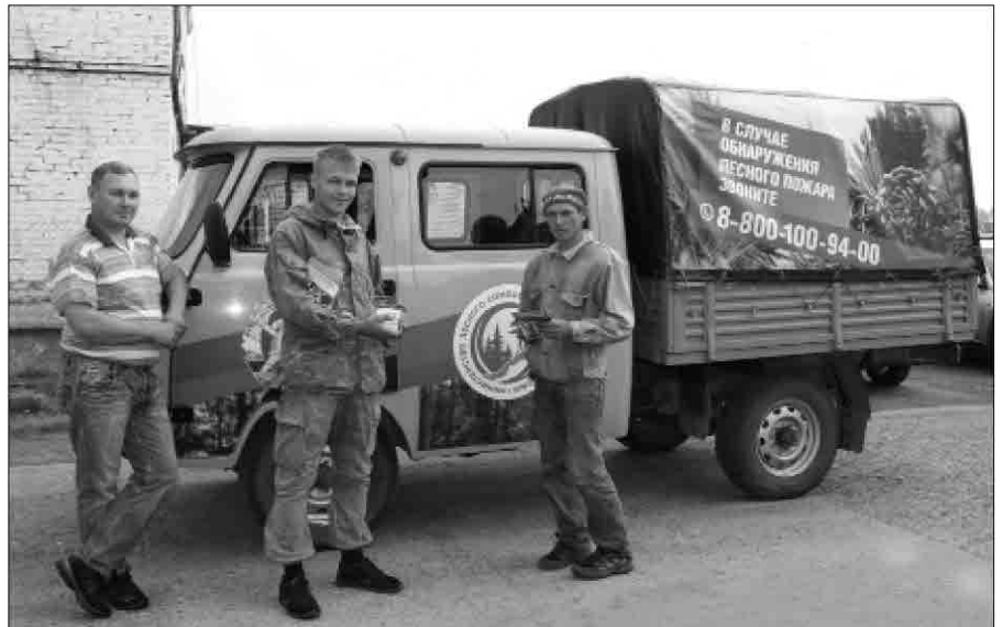
В селах Качугского района красочный УАЗ лесхозовцев частый гость

К слову, для эффективной пропаганды профилактики возникновения случаев нарушения правил пожарной безопасности лесным пожарным выделен новый автомобиль УАЗ - Фермер, он поступил в филиал Качугского участка АУ «Лесхоз Иркутской области» в 2017 году и только в этом сезоне доставил до населенных пунктов района порядка десяти тысяч экземпляров листовок, где кроме элементарных правил поведения в лесу, рассказывается о порядке действий человека в случае обнаружения лесного пожара, указаны кон-