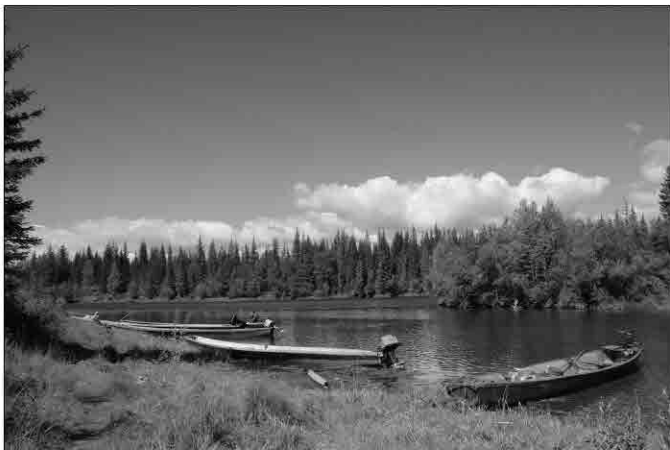
В этом месте Чанчур впадает в Лену