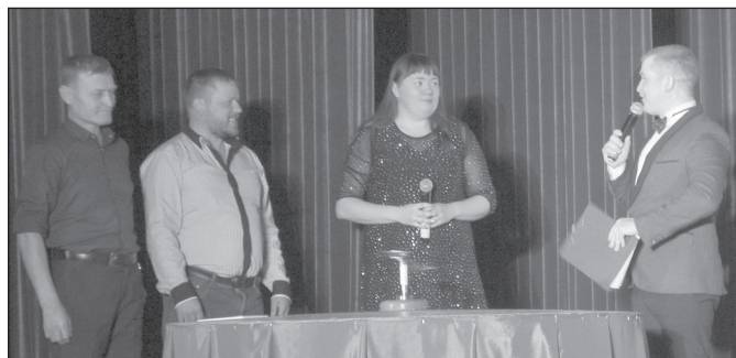
и «Кнопочки баянные»