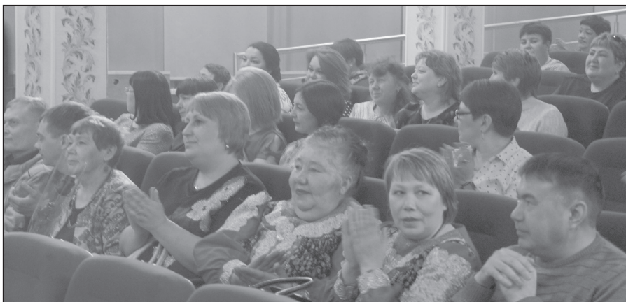
Не часто культработникам удаётся побыть зрителями в зале

Быть работником культуры — значит жить, дышать творчеством. Значит, находиться в центре самых ярких событий, значит, идти в ногу со временем, не забывая при этом о богатейшем культурном наследии, увлекать других своей кипучей энергией. Естественно, с течением времени меняются культурные запросы населения, само понимание досуга. И современные учреждения культуры находят новые формы общения с аудиторией, переосмысливают накопленный опыт, используют новые механизмы и принципы работы. Главной задачей остаётся обеспечение качественного, полезного, разнообразного и интересного досуга для всех категорий населения. Специалист сферы культуры должен иметь психологическое чутьё, быстро и правильно понимать людей, находить к ним индивидуальный подход, быть тактичным и, безусловно, талантливым. День работника культуры России празднуется очень широко, так как в городах и сель-