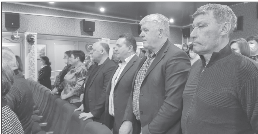
Работать в команде, не деля между уровнями власти полномочия, призывает глав поселений мэр