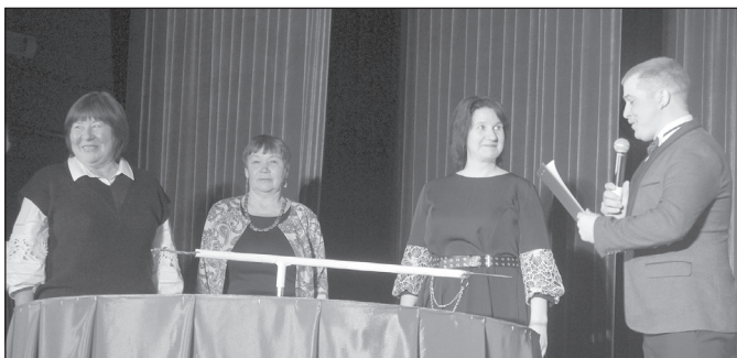
Разыгрываются призы в номинации «Менеджер года»