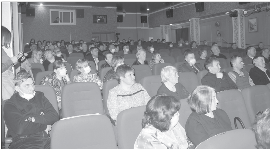
Для времён пандемии в зале многолюдно